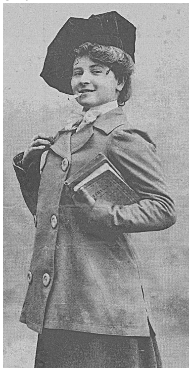
Naslovna fotografija razstave