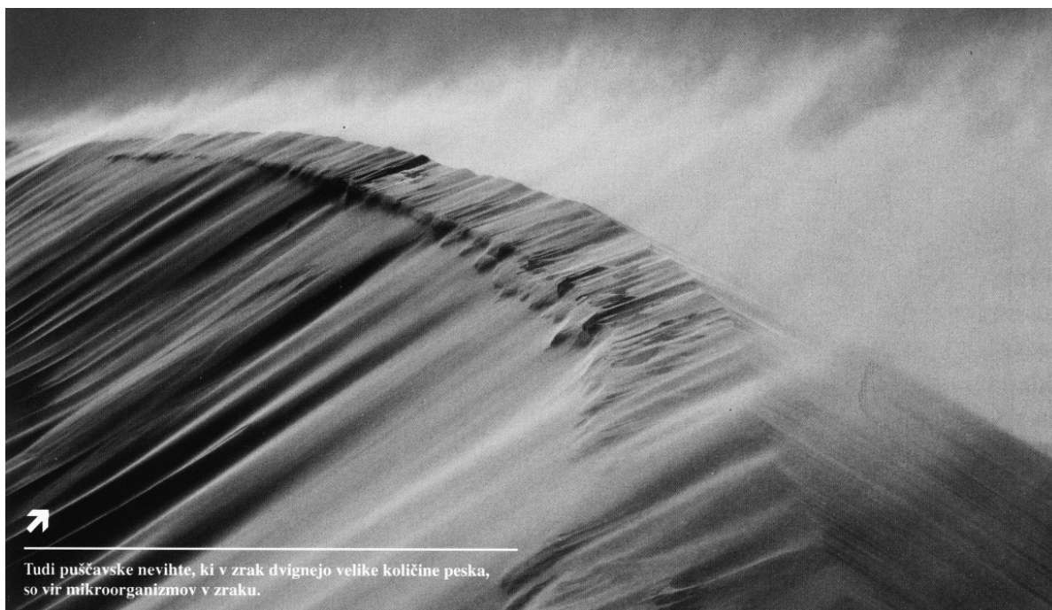
Tudi puščavske nevihte, ki v zrak dvignejo velike količine peska, so vir mikroorganizmov v zraku.

Mikroorganizmi so neverjetna bitja. Sposobni so prilagajanja na najrazličnejše razmere v okolju (od vročih vrelov do ledeno hladnih polarnih predelov), zato ni presenetljivo, da jih najdemo tudi v zraku. In ravno razvoj znanosti nam omogoča, da spoznavamo, kako to nevidno življenje okoli nas kroji usodo našega planeta in nas samih.