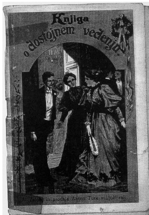
Knjiga o dostojnem vedenju