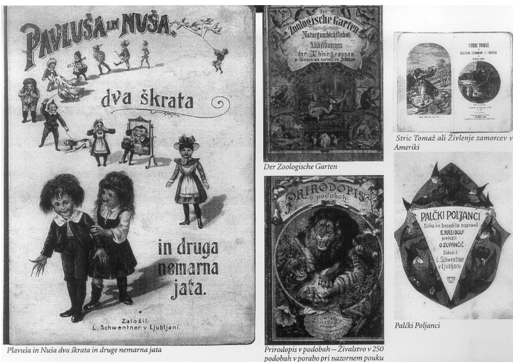
Plavuš in Nuša dva škrata in druge nemarna jata