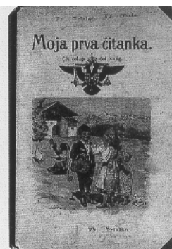
Moja prva čitanka