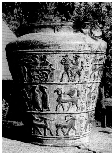
Slika 2: Na vaški situli opazimo celo upodobitev enoosnih vprežnih voz s potniki. Vse kaže, da gre v tem primeru za najstarejšo upodobitev cestnega vozila na naših tleh.