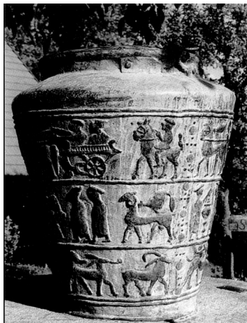
Slika 2: Na vaški situli opazimo celo upodobitev enoosnih vprežnih voz s potniki. Vse kaže, da gre v tem primeru za najstarejšo upodobitev cestnega vozila na naših tleh.