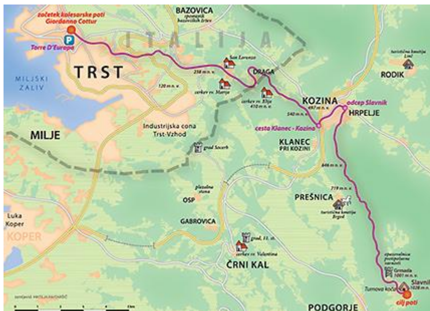
Zemljevid: Mateja Rihtaršič

Slavnik (1028 m) imena verjetno ni dobil zaradi svoje kolesarske slave. Bi ga pa lahko. Priljubljeni desetkilometrski makadamski klanec iz Kozine ponuja nekaj med treningom in kolesarsko turo. Razgled z vrha je vse prej kot skromen in morska modrina, ki označuje ničelno nadmorsko višino, bije v oči. Izziv se ponuja kar sam – kolesarjenje z obale do točke, kjer kopno prvič poskoči čez kilometer v višino. Slovenska obala ni prav priročna za naš namen, zato pa se kot idealno izhodišče ponuja Trst s svojo kolesarsko potjo Giordano Cottur. Speljana je po trasi nekdanje železniške proge, ki jo domačini imenujejo Štreka. Nekoč je skozi slikovito dolino Glinščice povezovala Trst s Hrpeljami. Pravzaprav ga še vedno, le da sedaj namesto vagončkov po njej brzijo kolesarji, tekači in pohodniki.