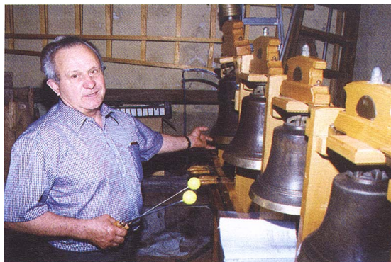
Miniaturni zvonovi za učenje pritrkavanja

Pitrkovalci so pravi ljudski umetniki. Pritrkavanje je ritmično zvonjenje, ko se glasovi posameznih zvonov zlivajo v melodijo, nastalo neposredno z udarci kladiv ali kembeljev, ki visijo v notranjosti zvonov. Po tem se pritrkavanje tudi bistveno razlikuje od navadnega zvonjenja, pri