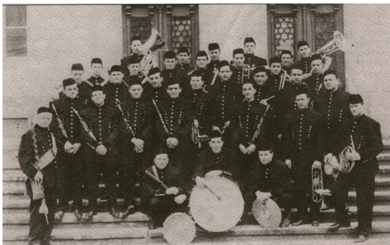
IDRIJSKA RUDARSKA GODBA NA PIHALA JE NAJSTAREJŠA V SLOVENIJI