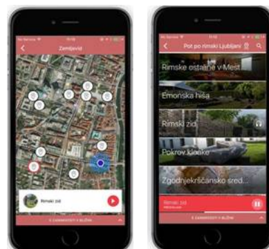
Vse poti vodijo v Emono!

Pa še namig: Po enournem potepanju po Arheološkem parku si v kateri od bližnjih slaščičarn naročite emonsko rezino, slastno tortico iz vaniljeve kreme in orehov s čokoladnim prelivom. Bene sapiat ali dober tek!