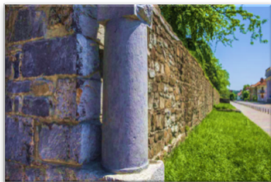
... in dobro znani Rimski zid

Pot do Emonske hiše se vije mimo današnjih zasebnih hiš in dvorišč, tako da je potrebno kar nekaj poguma in vztrajnosti pri iskanju te stavbe iz časa Rimljanov. Rimski zid na Mirju pozna skorajda vsak Ljubljančan. Ne vedo pa vsi, da je za njegovo sedanjo podobo zaslužen arhitekt Jože Plečnik. Kakšen je bil ta kos emonskega obzidja v rimskem času, ne vemo natančno: najbrž je bil do osem metrov visok in ometan, da je lažje ključeval vremenu. Zid in park ob njem sta ob temnih večerih skrivnostna, saj tam menda prebiva vila z Rimskega zidu, o kateri poje Ditka Haberl.