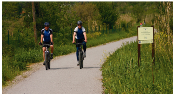
Krajinski park Sečoveljske soline

Do Izole iz Kopra ne bo težko priti, za nadaljevanje kolesarjenja pa se zaženimo v breg proti vasi Šared, a še prej zavijmo levo in navzgor skozi Barede do Gažona (243 m). Pot je obdana z mladimi oljčnimi nasadi. Sledi spust in prečkanje glavne prometnice ter manjši vzpon v Šmarje, od koder nas lepa panoramska asfaltna pot vodi do naselja Krkavče (175 m). Tu priporočam ogled oljčne stiskalnice, torklje, sicer pa je vas najbolj znana po krkavškem menhirju, megalitnem spomeniku, visokem več kot dva metra. Menhir je iz obdobja Kelto, to je iz 1. stoletja pr. n. št., namen izklesanih figur pa je bil vsekakor laskanje božanstvom. Sicer je tu zadnja točka pred spustom v dolino. Ta je k sreči asfaltiran, ne pa tudi dolina Dragonje, a zato nas bodo avtomobilisti pustili kolesariti v miru.