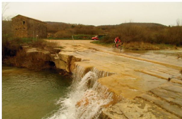
V dolini Dragonje bomo kolesarili v miru.

Do mejnega prehoda Dragonja nam res ni naporno, prav tako ne do Sečoveljskih solin, kjer si lahko ogledamo Muzej solinarstva. Najstarejši piranski rek se glasi »Piran xe fato de sal.« (Piran je nastal iz soli.), saj je poleg ribištva prav tradicionalno solinarstvo omogočilo razcvet mesta, čeprav so se morali meščani med solno sezono s svojimi ladjicami preseliti v solinarske hiše v neposredni bližini solnih polj. Bivanje na solinah so si uredili v kamnitih hišah, kjer so imeli vse najnujnejše za življenje in delo. V temnih kletah so skladiščili pridelano sol, v majhnih izbah so si privoščili kratek nočni počitek. Gospodinje so pekle kruh v posebnem kaminu za hišo. Solinarski muzej