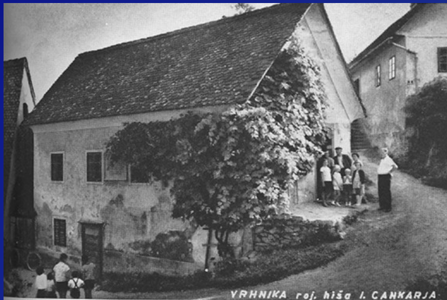
Cankarjeva rojstna hiša