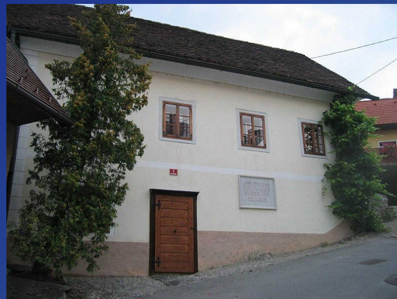
Cankarjeva spominska hiša, ki stoji na mestu njegove rojstne hiše