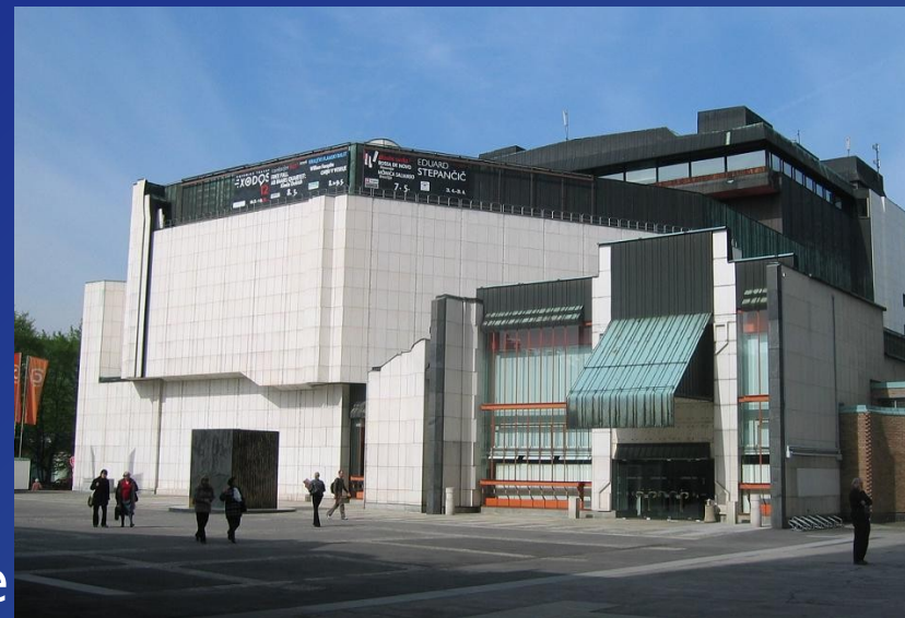
Cankarjev dom v Ljubljani