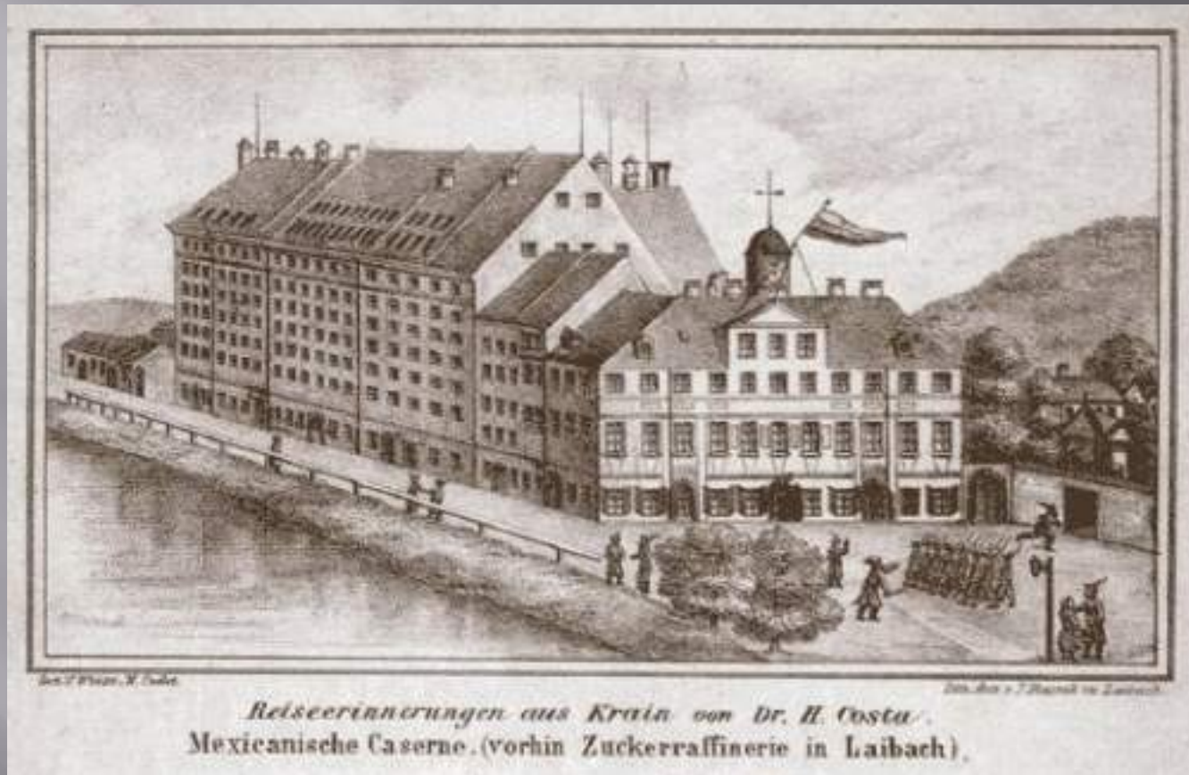
Reiseerinnerungen aus Krain von Dr. H. Costa. Mexicanische Caserne. (vornhin Zuckerraffinerie in Laibach).

Cukrarna v Ljubljani kjer je Kette prebil zadnje dni.