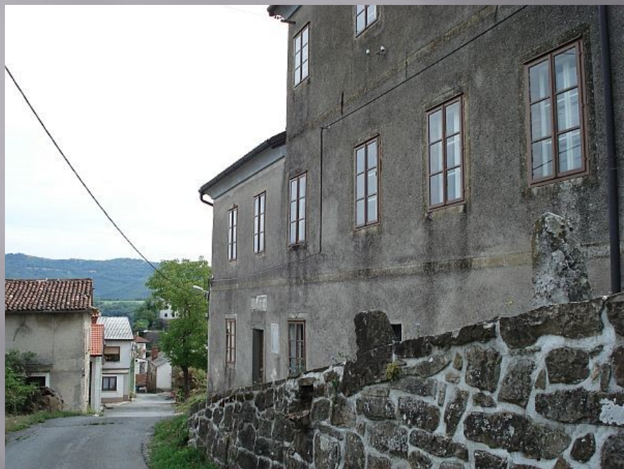
Rojstna hiša na Premu