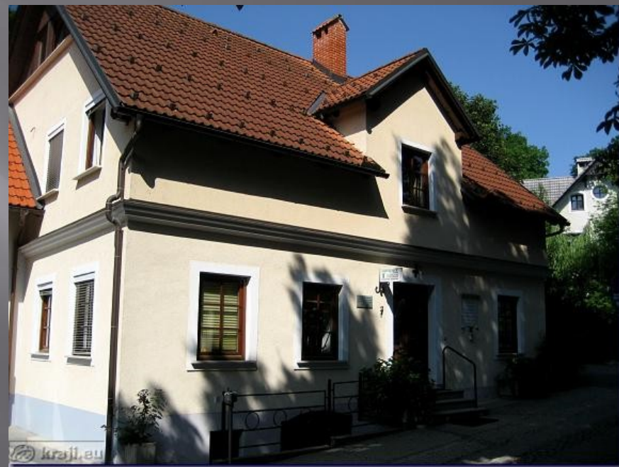
Hiša v Novem mestu