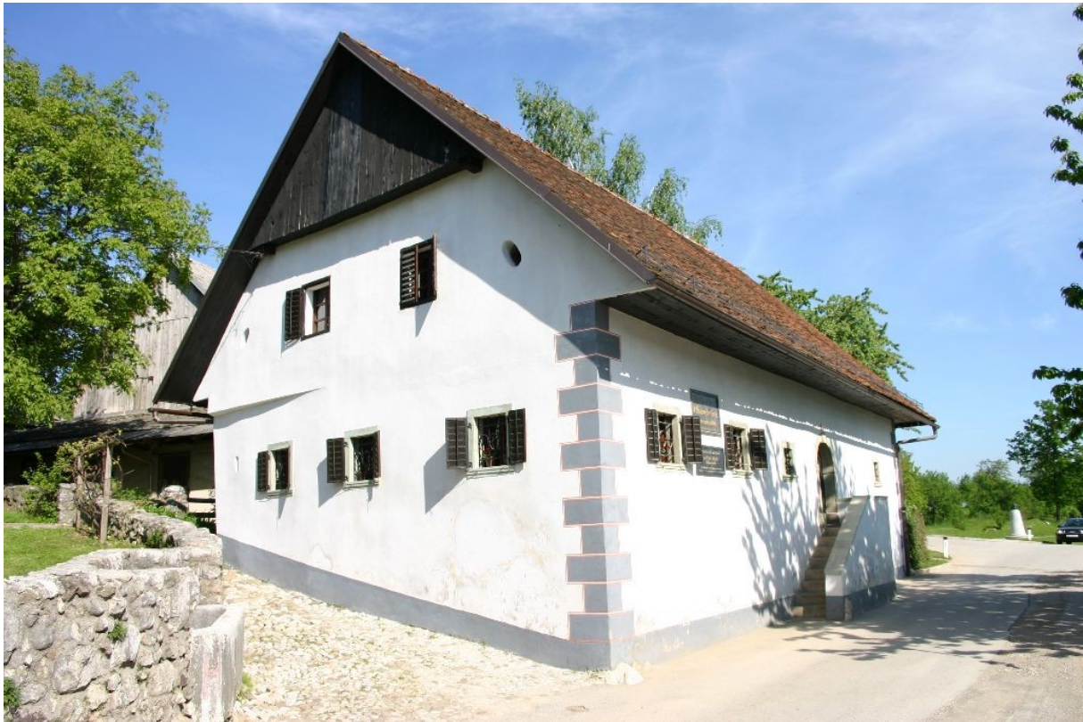
Slika 4: Prešernova hiša

Zelo malo držav na svetu ima kulturni praznik za dela prost dan. Mnogi se tudi sprašujejo, kako, da praznujemo smrt pesnika in ne obletnice njegovega rojstva in nekateri poznavalci odgovarjajo, da zato, ker se je rodil kot eden izmed šestih orok, umrl pa kot velik pesnik. Kakorkoli, njegov rojstni dan prav tako obeležimo s prireditvami imenovanimi "Ta veseli dan kulture", ko večina muzejev, gledališč in razstav brezplačno odpre svoja vrata vsem željnim kulture. Tako 8. februarja po celi Sloveniji potekajo kulturne prireditve, prav tako pa na ta dan podelijo Prešernove nagrade, ki so najvišja priznanja Republike Slovenije na področju umetnosti.