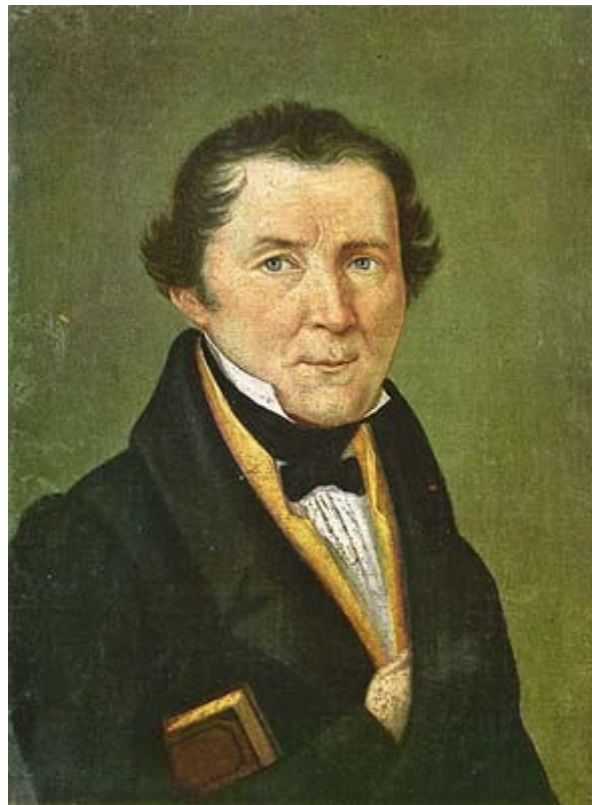
slika 4: Prešernov prijatelj Matija Čop