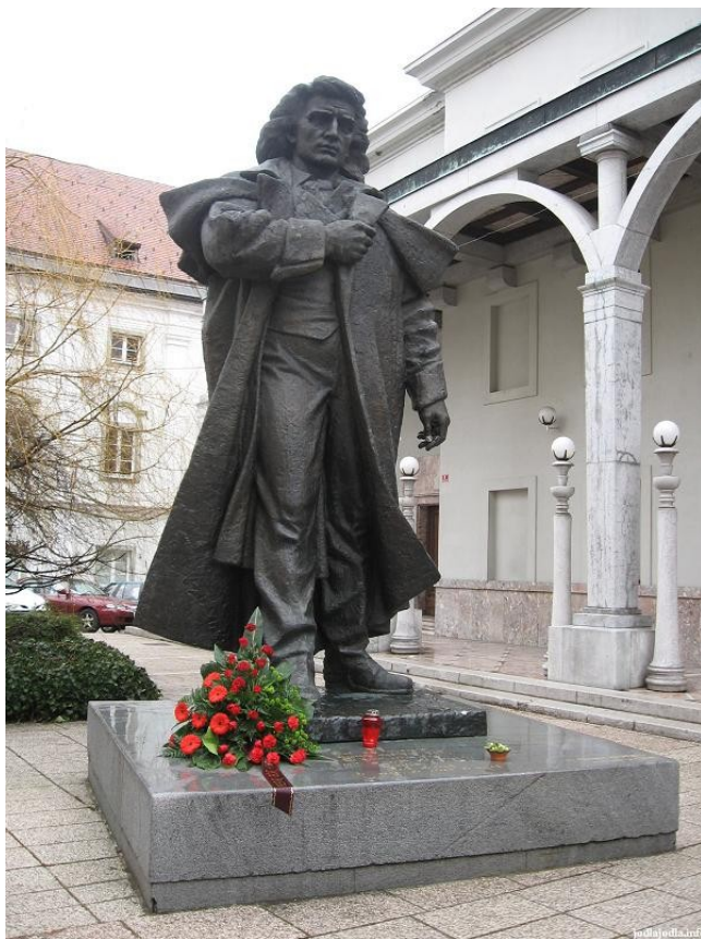
Slika 1: Prešernov spomenik

Živé naj vsi naródi, ki hrepené dočakat dan, ko, koder sonce hodi, prepir iz svéta bo pregnan, ko rojak prost bo vsak, ne vrag, le sosed bo mejak!