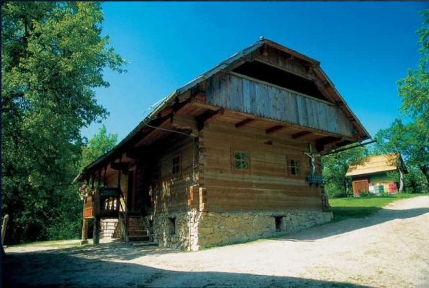
• Rojstna hiša Prežihovega Voranca