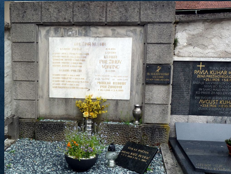
Grob Prežihovega Voranca