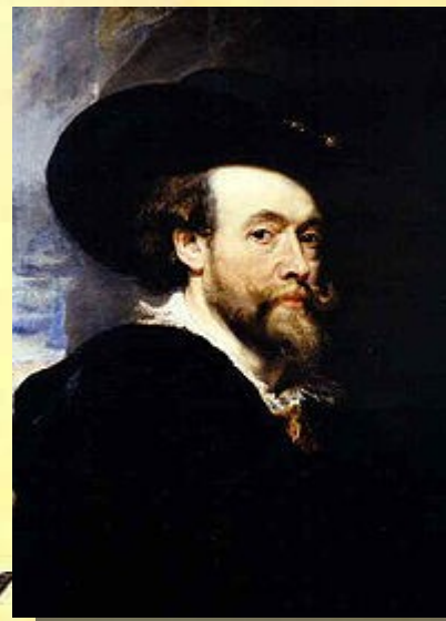
Slika: Avtoportret Rubensa