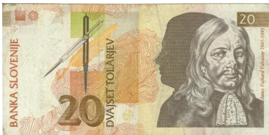
Valvasor na bankovcu za 20 tolarjev

Janez Vajkard Valvasor je bil velik človek, zato smo ga ovekovečili tudi na bankovcu za 20 tolarjev in mu postavili spomenik pred Narodnim muzejem v Ljubljani.