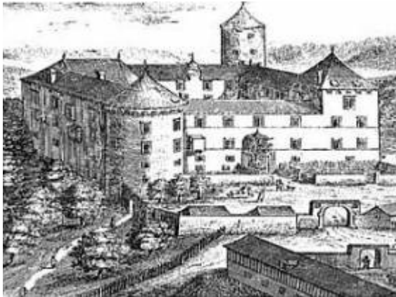
Grad Bogenšperk nekoč...