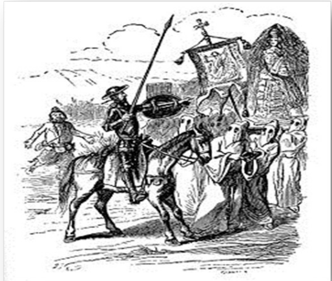
SLIKA 5 DON KIHOT(VIR:DORE GUSTAVE, 1981)

Miguel de Cervantes se je rodil leta 1547 v Španiji. Bil je pesnik, dramatik in pisec novel. Svoj preboj je dosegel ko je leta 1585 napisal Galatejo, kasneje pa se je proslavil z dvema deloma Don Kihota, ki ga je napisal v dveh delih, prvi del leta 1605, drugi pa leta 1615. Roman o Donu Kihotu je napisal kot parodijo oz. kritiko preteklim viteškim romanom. To delo je bilo ključno za razvoj tako imenovane viteške romantike. Sam Don Kihot je nekakšna reakcija na vsesplošno evforijo, hkrati pa je parodija prvotnega viteškega romana.