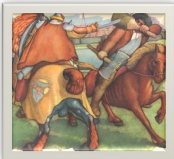
SLIKA 1 MARTIN KRPAN

Dramo o Erazmu Predjamskem pa je hotel napisati tudi Ivan Tavčar, vendar mu ni uspelo, leta 1978 pa je Saša Vuga tega slavnega viteza postavil v vlogo glavnega junaka v svojem romanu, ki je obsegal kar tri obsežna dela (Erazem Predjamski ali vsa drzna in predrzna dejanja stotnika cesarjeve telesne straže). Poleg predjamskega viteza, se je v začetku slovenske pripovedne proze pojavilo besedilo, ki ga lahko beremo kor parodijo junaškega epa oziroma viteškega romana. To delo je Levstikova slavna pripoved o Martinu Krpanu. Krpan spominja na Sanča Panso, don Kitovega komičnega slugo. Viteški romani, kot književna vrsta pri nas niso nastajali v velikem številu, kljub temu pa je v času, ko so po celem svetu nastajale junaške proze (sr. Vek) tudi v Sloveniji nekaj umetnikov