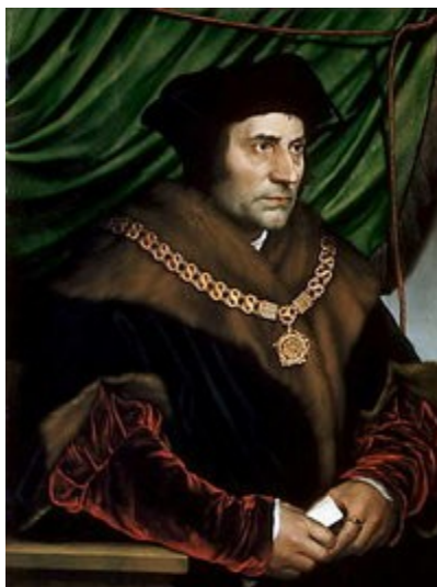
Thomas More (06.07.1535), velikega učenjaka Henrik VIII usmrti.

V Londonu so obglavili angleškega državnika in humanista Thomasa Mora, ki je zaradi nasprotovanja ločitvi Henrika VIII. od Katarine Aragonske, zašel v nemilost.