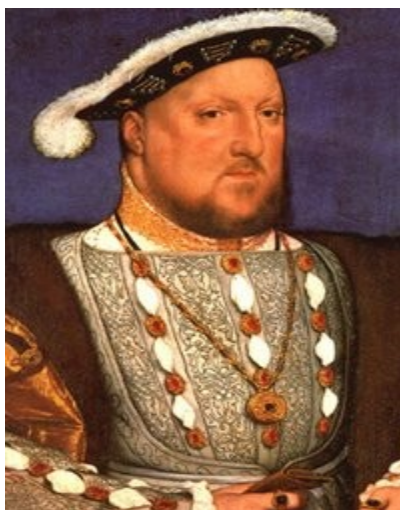
Angleški kralj Henrik VIII, bil je 6 krat poročen.

Angleški kralj Henrik VIII. je imel že pred reformacijo odločilen vpliv na angleško cerkev. Reformacije v Angliji ne sproži versko gibanje ljudstva ali kakega posameznika, pač pa jo ukažejo od zgoraj. Odločilno vlogo pri tem ima kralj Henrik VIII. (1509-1547). Henrik VIII. so prvotno namenili duhovniško pot, zato je bil temu primerno teološko izobražen; v zgodnjih letih vladanja je bil zvest sin srednjeveške cerkve. Proti Martinu Luthru (začetnik nemške reformacije) je zagovarjal sedmero zakramentov, za kar ga je papež odlikoval s pridevkom defensor fidei (branilec vere). Skupaj z svojim lordom kanclerjem Thomasom Morom je Henrik VIII. ostro napadel tudi prevod Biblije Williama Tyndala.