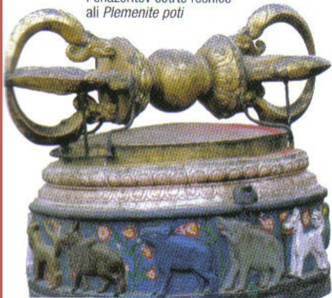
Ponazoritev četrte resnice ali Plemenite poti