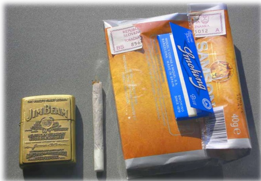
Slika 2: Tobačne cigarete

To je rastlina, iz katere pridelujejo cigarete, cigare, žvečilni tobak, tobak za pipe in za njuhanje. V cigarah je veliko škodljivih snovi, najpogostejše so katran, nikotin, ki je najbolj škodljiv, in ogljikov monoksid. Kajenje lahko povzroča pogostejšo obolenje kot pri nekadilcih, pogosto kašljanje, zmanjša se kapaciteta pljuč, zmožnost za športno udejstvovanje, zmožnost porabe vitamin C, pojavijo pa se tudi obolenja v ustni votlini. Kajenje prinaša hiter občutek ugodja, saj se droge preko pljučnega obtoka dosežejo učinek že v manj kot pol sekunde.