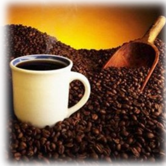
Slika 1: Kava

To je droga, s katero ljudje najprej pridejo v stik. Prisoten je v večini kola pijač, čokoladi, čaju in kavi. Kofeinizem, ki je klasificiran kot bolezen, povzroča, odvisno od doze, nemir, vznurjenje, nespečnost, obrazno rdečico.