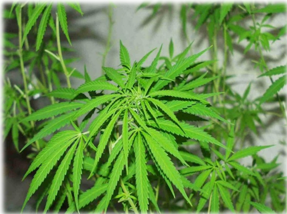
Slika 4: Konoplja

Kajenje marihuane oz. hašiša je močno povezano s kajenjem cigaret in opijanjem, pri nekaterih mladostnikih pa tudi z uporabo drugih drog. Leta 1999 je bilo med mladimi, ki so v zadnjem mesecu kadili marihuano, 75% v tema času opitih najmanj enkrat, 25 pa jih je že jemalo kombinacijo alkohola in tablet, od tega 20% ecstasy, 5% heroin.