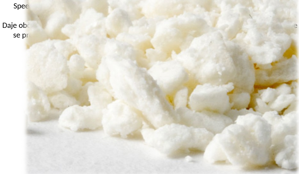
Slika 10: Speed