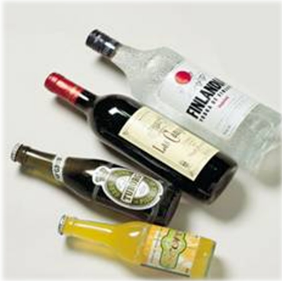
Slika 3: Alkohol

Učinki so odvisni od količine popitega alkohola, telesne teže, prehrane, psihičnega razpoloženja in hitrosti pitja. Preveč alkohola povzroča pijanost, katere znaki so težave pri govoru, hoji, spominu, neustrezno presojanje, slabost v želodcu, bruhanje, koma in nezavest. Lahko se pojavi ciroza jeter, odvisnost od alkohola, bolezni srca, srčni infarkt, želodčni rak, rak ustne votline, ohromitev možganov, duševne bolezni, govorne težave, otečenost možganov, nastopi pa tudi lahko zastrupitev z alkoholom.