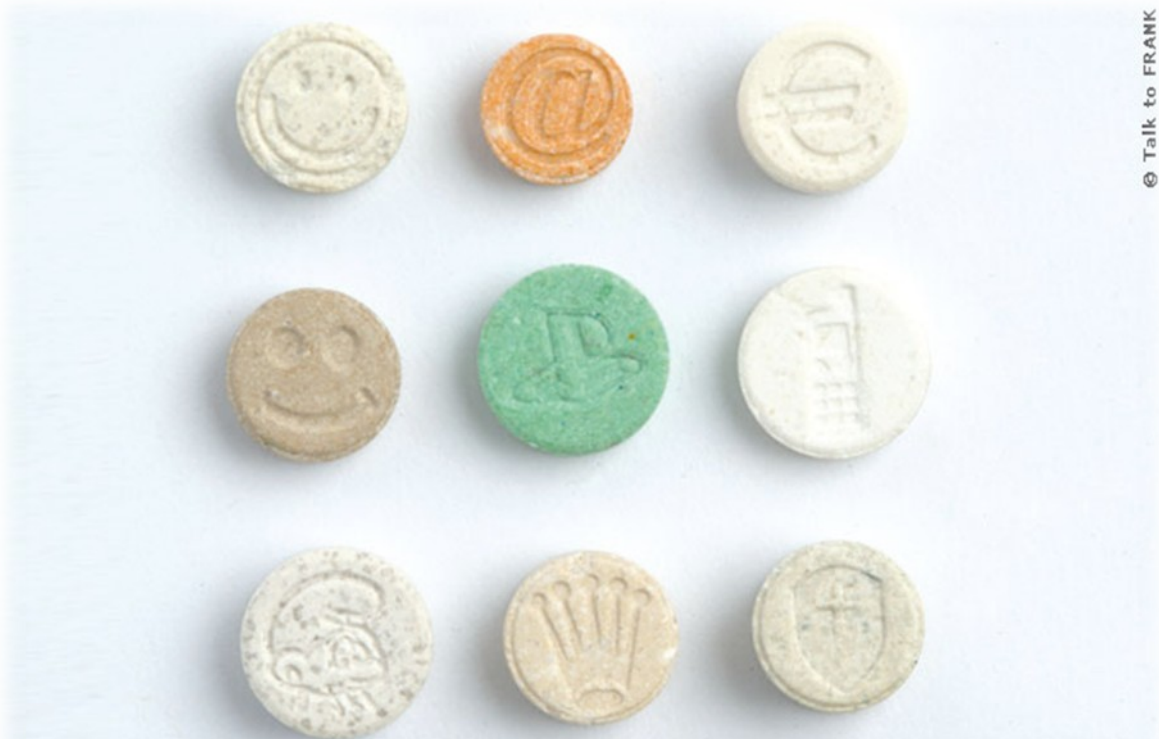
Slika 5: LSD tabletke

LSD je psihedelična droga, kar pomeni, da spreminja zaznavanje ali doživljanje okolice. Nastane v kemičnem laboratoriju, ko iz rženega rožička izločijo črn glivični izrastek, ki je osnovna substanca za pridobivanje LSD. Pojavlja se v obliki raznobarnih drobnih tabletk in prepojenih pivnikov. Učinki delovanja so slinjenje, siljenje k bljuvanju, potenje, vrtoglavica, motnje čustvovanja in razpoloženja, motnje zaznavanja, predstavljanja, mišljenja. Posledice so kratkotrajno stanje paničnosti, potrnost, dlje časa trajajoče stanje depresivne naveličnosti in razmišljanje o smrti.