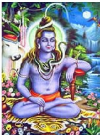
Slika 4: Bog Šiva

kipih kot bog plesa. Šiva združuje moške in ženske lastnosti. Predstavljajo ga sedečega na tigrovi koži v visokih gorah med skalami in ledeniki. V rokah drži trirog, okrog vratu pa ima ogrlico iz človeških lobanj. Iz njegovih dolgih las izvira Ganges. Šiva je samotar, zato so si ga sadhuji in jogiji izbrali za zavetnika.