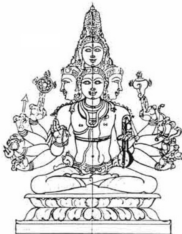
Slika 1: Brahman

Hinduizem je zelo raznolika religija, razvijala se je dolgo časa in nima enega samega utemeljitelja. Prav tako se zdi, da se različne vrste hinduizma toliko ločijo druga od druge, kot da so nekaj čisto drugega. Za mnoge hindujce pa je pod vso to raznolikostjo ena sama nespremenljiva resničnost. Imenuje se brahman.