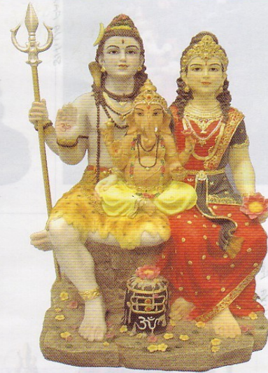
81942-XL 25.5"H X 15"W X 13.5"D