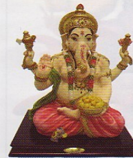
81916 13"H X 8.5"W