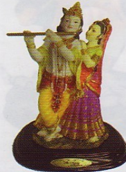
81924-SS 5"H X 4"W X 3"D