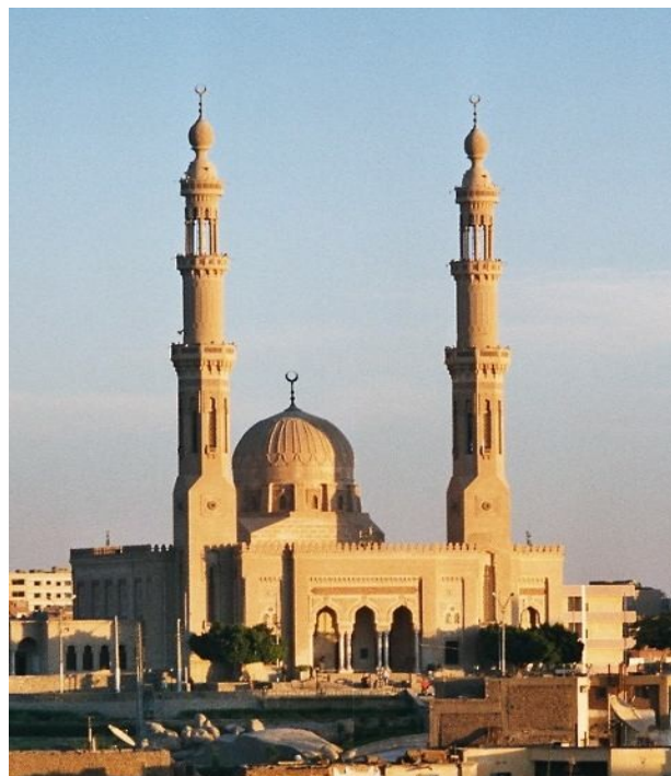
Egipt, Aswan, mošeja