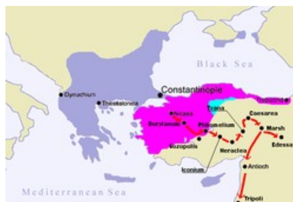
Slika 4: Pot prve križarske vojne

Prvo križarsko vojno je začel papež Urban II leta 1095. Cilj pohoda je bil prevzeti Sveto deželo izpod Muslimanov in ubraniti Bizantinsko cesarstvo izpod Seldžukov, ker se jih Bizanc ni mogel otresti. Prva križarska vojna se je končala dobro saj so po njenem koncu v Palestini in Siriji nastale štiri nove države.