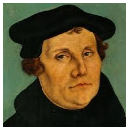
Slika 5: Martin Luther

Papež je Lutra zaradi upora izobčil iz cerkve, prav tako tudi cesar. Zaradi reforme je prišlo do razkola cerkve. Na severu so bili protestanti, na jugu pa katoliki.