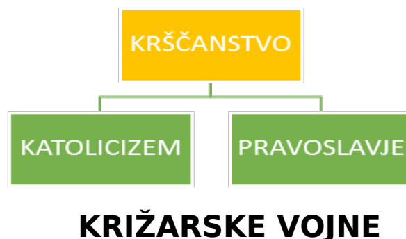
Diagram 1: Razdelitev krščanstva

Leta 1054 je prišlo do spora med gospodarjem cerkve v Konstantinoplu in papežem, gospodarjem cerkve v Rimu. Starešina vzhodne cerkve ni hotel priznati rimskega papeža za vrhovnega poglavarja. Problem je bil tudi v jeziku. V Rimu se je uporabljala latinščina, medtem ko so v Bizancu uporabljali grščino. Spor je nastal, ker se niso mogli dogovoriti ali naj se duhovniki poročajo in na kateri datum se bo praznovala velika noč. To je pripeljalo do razkola cerkve na zahodno rimokatoliško in vzhodno pravoslavno cerkev.