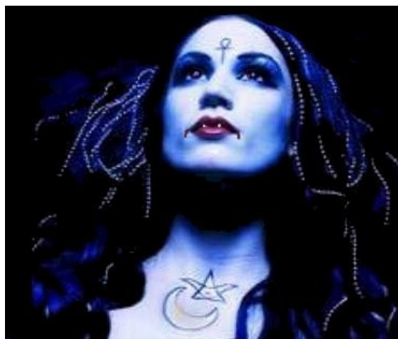
Slika 2: Ženska s simboli

Magično delovanje temelji na dveh načelih, načelu stika –stičnosti in načelu podobnosti-simbolne povezave. Preprost primer: magični vpliv na neko osebo naj bi bilo najlažje doseči s pomočjo predmetov, ki pripadajo tej osebi ali celo njenemu telesu (lasje, obleka) so bile torej v stiku z njo, ali pa predmetov, ki predstavljajo njeno podobo in jo simbolizirajo ( fotografije,