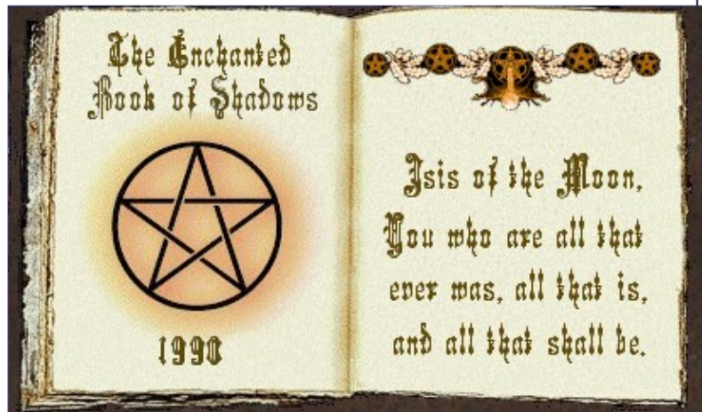
Slika 11: Knjiga senc

Knjiga senc je knjiga v katero čaravnice zapisujejo informacije kot so uroki in magične izkušnje. Tako ime so predlagali zato, ker so čaravnice v zgodovini morale svoje vaje skrivati, torej je bila ta knjiga zelo skrita (v sencah).