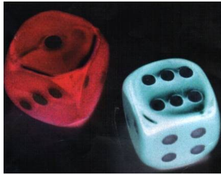
Slika 6: Kocke

Napovedovanje človekove prihodnosti s kockami sega daleč nazaj, vsaj do leta 2000 pr.n.š. Kocke so metali že stari Egipčani, pa tudi Grki in Rimljani. Razvile so se iz kosti po katerih so vedeževali ob verskih obredih. Že na začetku pa so kocke uporabljali tudi za vse mogoče igre. Napovedovanje prihodnosti s kockami se je najbrž razvilo iz vedeževanja z žrebom. Arabci so metali kocke, ampak so si izmislili drugačen postopek: kamenček so stresli na kup. In jih nato na slepo srečo pobirali iz njega, pri tem pa ugotavljali, kaj napovedujejo. Temu pravijo Angleži psephomancy iz grške besede kamenček. Grki so isto besedo uporabljali za glasovanje, od tod sodoben angleški izraz- znanstvena (ne iz metanja kosti ali kock) analiza vodilnih trendov ali izidov. Navadnih kamenčkov ni bilo treba posebej označevati, saj so bili dovolj različni. Ponavadi je vedeževalec, ki je poznal posamezni pomen kamnov, skrivnost ohranil zase. Še danes vrači v Afriki, prerokujejo z vrečko kamnov modrijanov. Metanje kock je povezano s metanjem ali izbiranjem run. Toda za vedeževanje iz kock je zelo veliko načinov, njihovo bistvo pa so ponavadi skrbno varovali kot skrivnost, tako da niti za najbolj