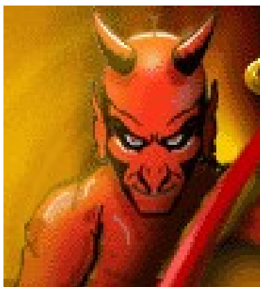
Slika 8: Hudič

Beseda satan se nanaša na višje duhovno bitje (satan= nasprotnik, sovražnik, v prevodu diablo). Satanizem pomeni oboževanje duhovne sile, ki jo judovska in krščanska tradicija smatrata za izvor zla. Vsekakor pa moramo ločiti pojem satanizma v rabi, s katero pripadniki teh verstev označujejo častilce višjih sil, ki se ne ujemajo s predstavami krščanstva, od kultov, ki se obračajo na svetopisemsko osebo Satana. V prvem primeru mnogokrat seveda ne gre za oboževalce zla, vsaj ne po njihovem lastnem prepričanju. Tu torej ne more biti govora o satanizmu v pristnem pomenu besede. S satanizmom se tako včasih označujejo obredja čaščenja demonskih sil, v katerih so kristjani, judaisti in muslimani videli simbole ali personifikacije hudiča.