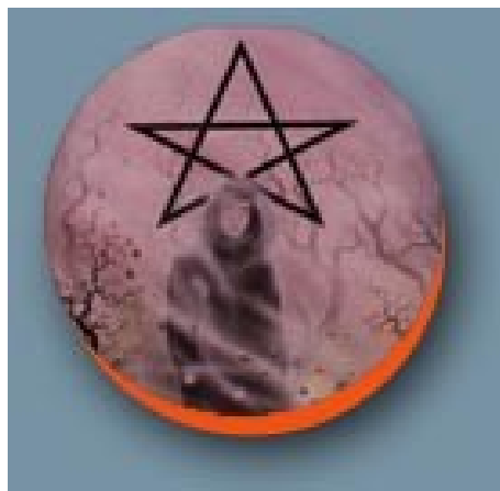
Slika 1: Magija