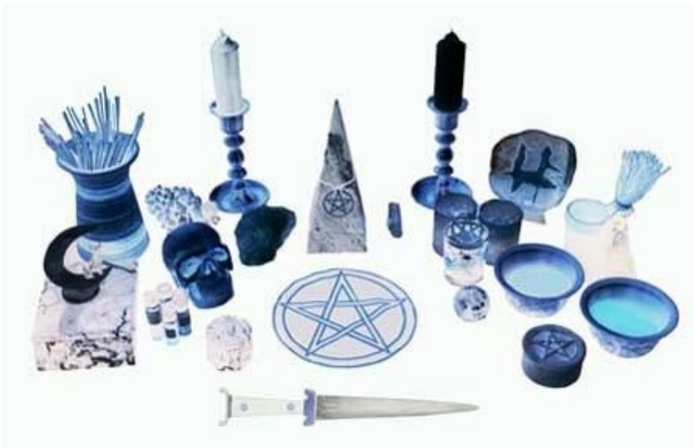
Slika 9: Magični pripomočki

S kulturnim obredjem so skušali ljudje od nekdanj stopati v stik z njim in pridobiti njihovo naklonjenost. V tem pogledu obredi niso nič drugega kot postopki, ki bi naj vse to omogočili. Ljudje so bili prepričani, da za kaj takega ne zadostujejo navadne želje in dejanja ampak da so za to potrebni posebni postopki. Po vsej verjetnosti je prav čaščenje višjih sil temeljni izvor obredja. Magi morajo imeti posebne prostore v katerih lahko nemoteno opravljajo svoje magične rituale. Vsaki mag skrbno varuje svoje recepte in znanje,ki ga zelo dobro skriva in varuje.