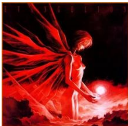
Slika 3: Angelska duša