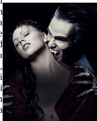
Slika 7: Vampir

Nekatera pošastna bitja so povezana s predstavami o duševni obsedenosti in telesnem preobraževanju, npr., volkodlaki in vampirji, ki tudi lahko spremenijo svojo podobo. Njihova zmožnost, da obsedejo druge, morda kaže na to, da lahko senčne strani naše narave prevzamejo pri drugih prav tako nadzor nad duševnostjo, kot pri nas, kot da bi šlo za neke vrste duševno infekcijo. Nadzor pa pomeni, da delujejo te sile avtonomno, neodvisno od naše volje. Duševna obsedenost je prisotna tudi pri legendi o zombijih-mrličih, ki jih ljudje s posebnimi močmi oživijo, da jim služijo kot brezdušni roboti. Pripadnost temnim silam še poudarja dejstvo, da gre pri volkodlakih in vampirjih za nočna bitja. Zelo pogosto jih povezujejo z delovanjem zlih duhov in demonskih, torej duhovnih negativnih sil. Tudi njihova umrljivost se dotika pomembne teme, problema smrti in življenja. Sesanje krvi je prisposoba jemanja življenjske substance. Morda so posebni načini ki jim pomagajo odstraniti vampirje prisposoba načinov, kako se otresemo vpliva naših globinskih strahov. Simbolno vrednost ima morda tudi način, kako lahko prepoznamo vampirja; v ogledalu njegove podobe ni, torej je njegova resnica relativna, stvar duhovne kreacije.