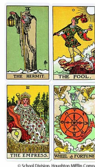
Slika 4: Tarot

Izvor tarota je v bistvu nejasen. V slikovnih simbolih nekaterih kart so prepoznavni egipčanski elementi, skoraj gotovo pa je, da ne izvirajo iz stare egiptovske Totove knjige. Po dosegljivih virih lahko sklepamo, da so prve tarot karte pojavile v renesančni Italiji, razvile pa so se iz igralnih kart. Tarot je bil v začetku samo vrsta igre s kartami. Vendar slike jasno predstavljajo podobo človeške družbe, da so z njimi verjetno kmalu poskusili vedeževati, tako kot z navadnimi kartami. Že več stoletij ga uporabljamo za vedeževanje, pogosto z velikim uspehom. Vedeževalec mora natančno poznati pomen posamezne karte pa tudi njihovo medsebojno razmerje; če hoče, da bo intuicija, bistveni element pri tem in mnogih podobnih vedeževanjih, delovala, mora biti pri svojem delu zbran.