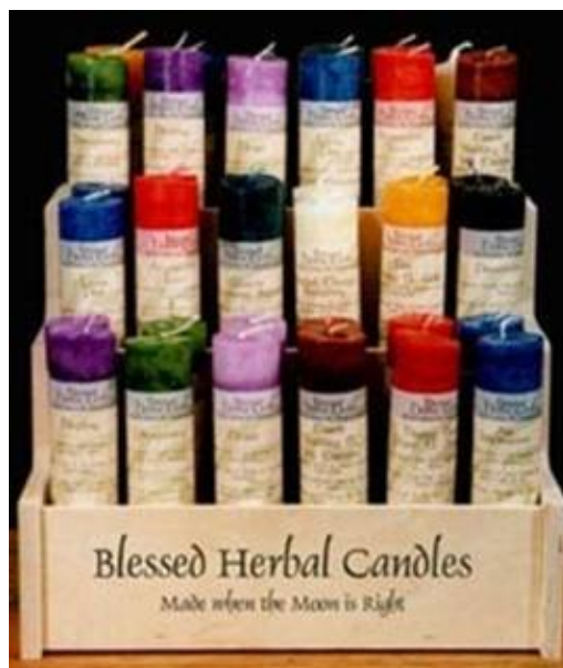
Slika 10: Sveče

Za obrede je potreben ogenj, ki ga simbolizirajo sveče. Sveče so zelo različnih barv in prav to jim daje poseben značaj.