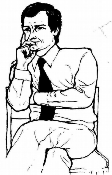
SLIKA 5: Paket kretenj, značilnih za kritično-razmišljujoče razpoloženje