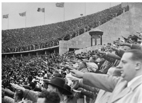
Slika 1: Nacistični pozdrav Hitlerju na olimpijskem stadionu

Zmaga nemškega športnika je pomenila zmago političnega sistema. Drugo mesto je pomenilo sramoto, in tako je bilo vedno, ko je šlo za dokazovanje superiornosti naroda oziroma za tekmovanje med dvema nasprotujočima si režimoma (predvsem komunizma in kapitalizma v hladni vojni). Ker drugega načina včasih ni bilo, so bile igre odskočna deska za uveljavitev ideologije v svetu, potrditev, nadvlado. ( http://dk.fdv.uni-lj.si/dela/Fain-Zagomilsek.PDF )