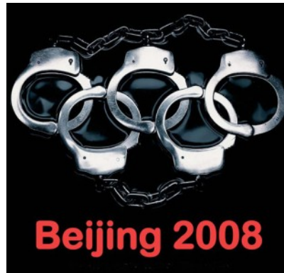
Slika 2: Olimpijski plakati gibanja za osvoboditev Tibeta

( http://24ur.com/novice/svet/olimpijada-z-zamikom.html in http://24ur.com/novice/svet/cenzura-tudi-v-medijskem-srediscu-oi.html )