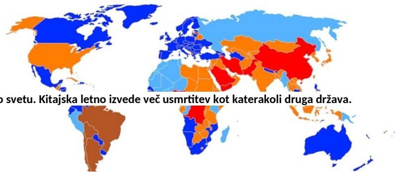
Slika 3: Smrtna kazen po svetu. Kitajska letno izvede več usmrtitev kot katerakoli druga država.