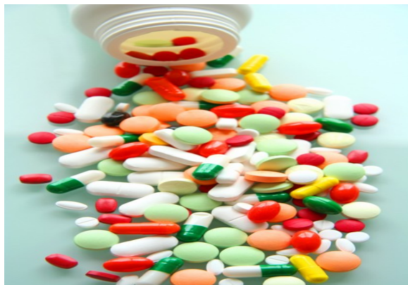
Slika 2 - trde droge

Prostituiranje pusti za seboj fizične in psihične posledice. Pogoste psihične težave so različne travme, stres, depresije in anksioznost. Veliko prostitutk in prostitutov se zato zateče k samoterapiji z alkoholom in drugimi drogami. Največ je prisotnega alkohola, še posebej pri ženskah, ki delajo po nočnih lokalih, kjer je omamljanje pralitično službena obveza. Obstaja več pričevanj o odvisnicah od heroina, ki delajo kot prostitutke. V višjih krogih in pri tistih, ki zaslužijo večje vsote, je bolj prisoten kokain. Nekateri zvodniki dajejo prostitutkam droge, zaradi katerih so potem bolj voljne med spolnimi odnosi. Mamila lahko obenem zvodnikom služijo tudi kot učinkovito sredstvo za vzpostavljanje kontrole nad prostitutkami.