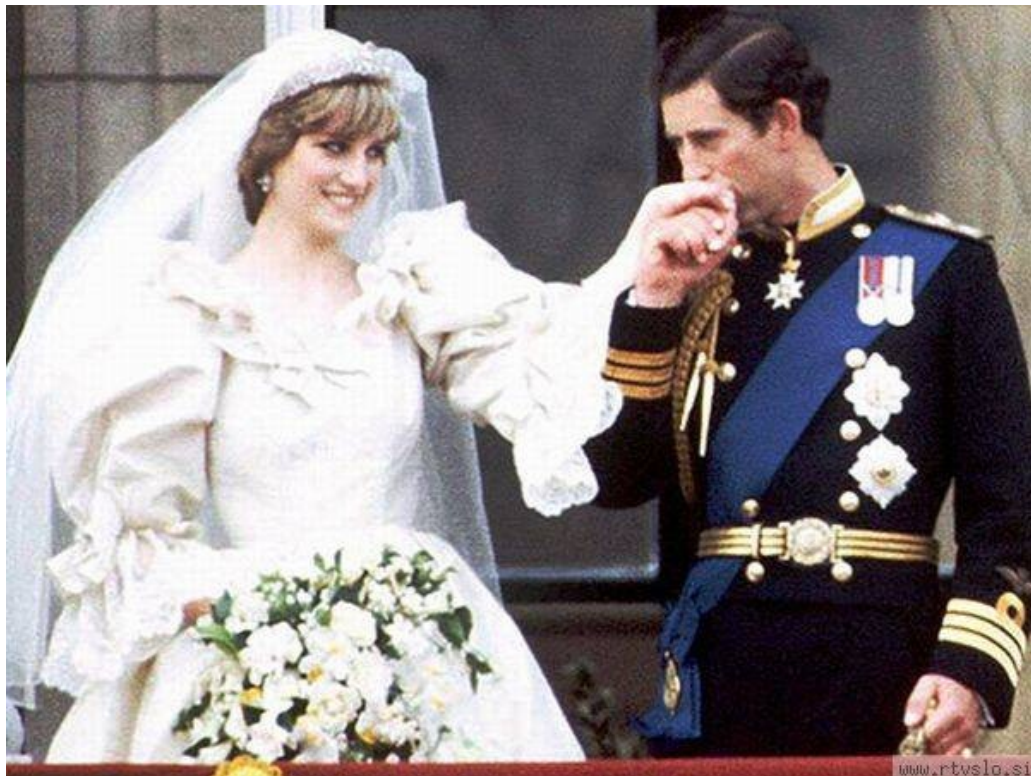
Slika 8: Sveti zakon

Nato si nadeneta poročna prstana. Navzoče cerkveno občestvo ju spremlja z molitvijo. Kristjani tako začenjajo zakonsko in družinsko življenje.