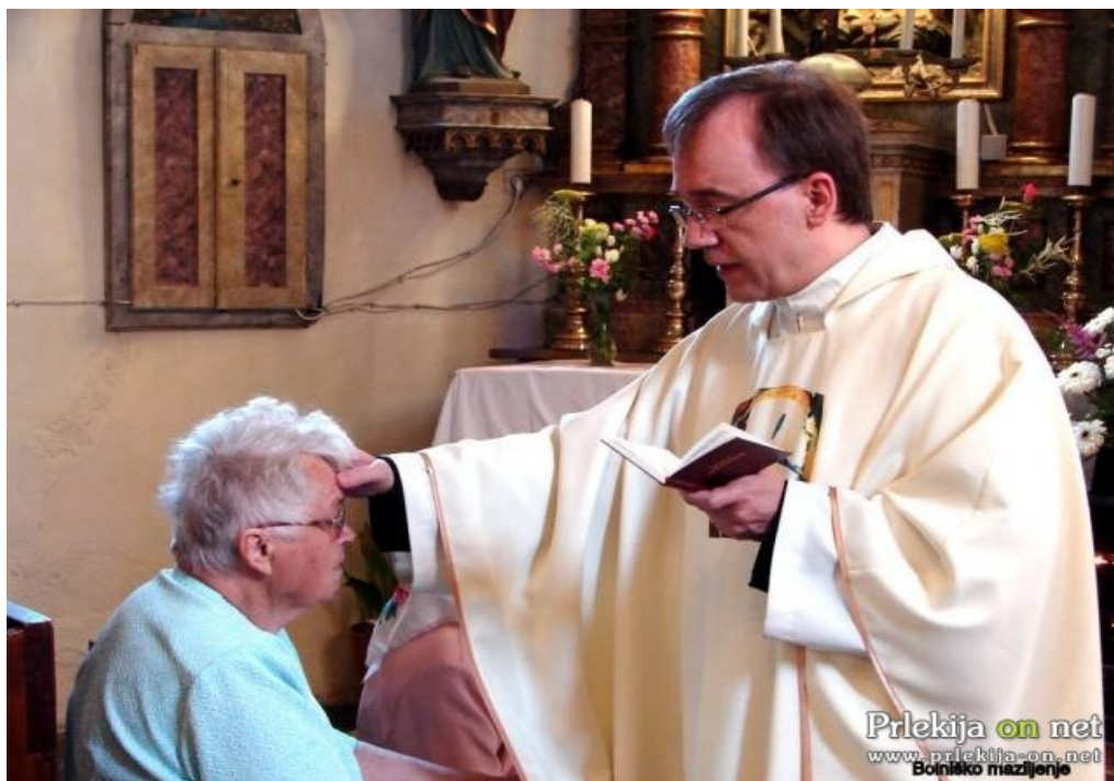
Slika 6: Sveto bolniško maziljenje

Duhovnik mazili bolnika z bolniškim oljem na čelu in dlaneh. Pri tem moli: »Po tem svetem maziljenju in svojem dobrotnem usmiljenju naj ti Gospod pomaga z milostjo Svetega Duha, odpusti naj ti grehe, te reši in milostno poživi.«