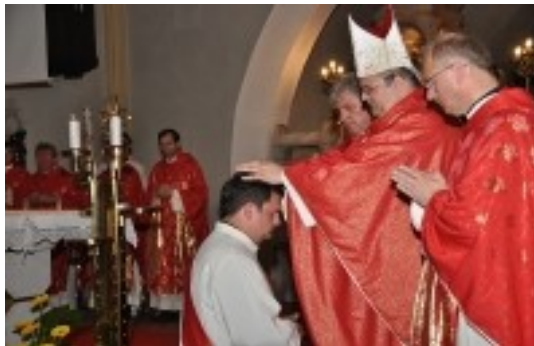
Slika 7: Sveto mašniško posvečenje

Novoposvečeni duhovniki ali novomašniki prejmejo štolo in mašni plašč, ki sta znamenje duhovniške službe. Škof jim s sveto krizmo mazili roke ter jim da v roke pateno s hostijo in kelih z vinom za daritev svete maše. S škofom nadaljujejo sveto mašo, pri kateri prvič somašujejo.