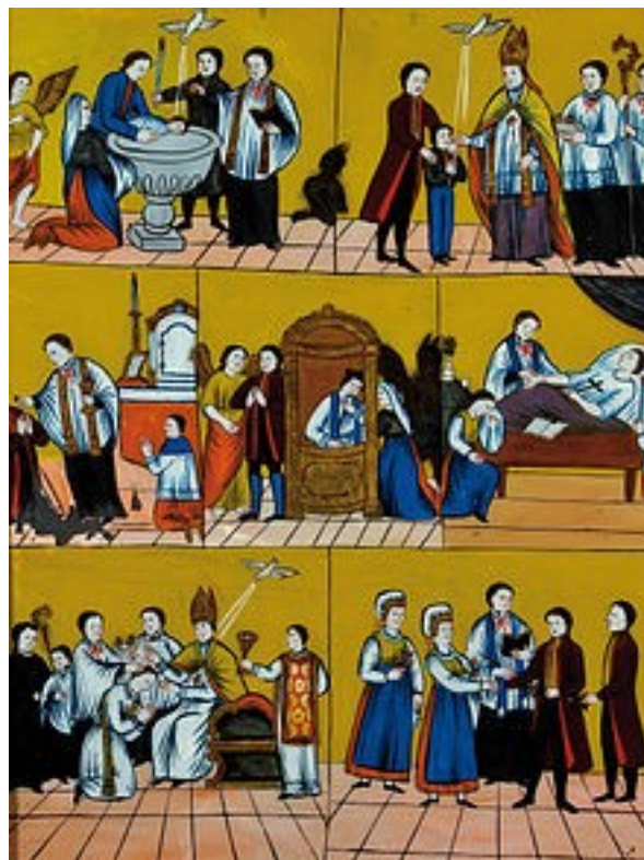
Slika 9: Sveti zakramenti

Pomagala sem si z internetnimi, predvsem pa z knjižnimi viri.