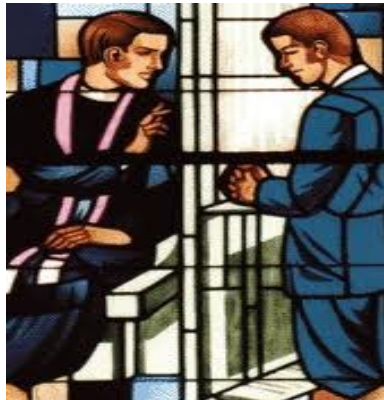
Slika 5: Sveta pokora

Jaz te odvežem tvojih grehov v imenu Očeta in Sina in Svetega Duha.