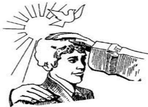
Slika 3: Birmovalec položi birmancu roko na glavo

Birmovalec položi birmancu roko na glavo in mu pri tem s sveto krizmo naredi križ na čelu. Pri tem govori: »sprejmi potrditev – dar Svetega Duha.«