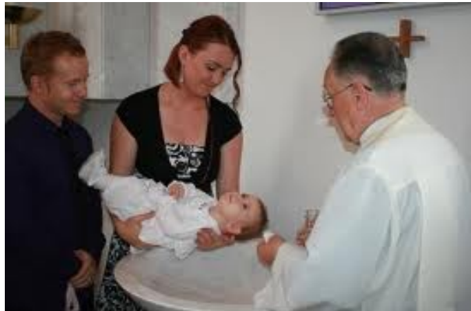
Slika 2: Sveti krst

Krst je prvi in najpotrebnejši zakrament. Vtisne nam neizbrisno duhovno znamenje božjega otroštva. Zato ga prejmemo le enkrat v življenju.