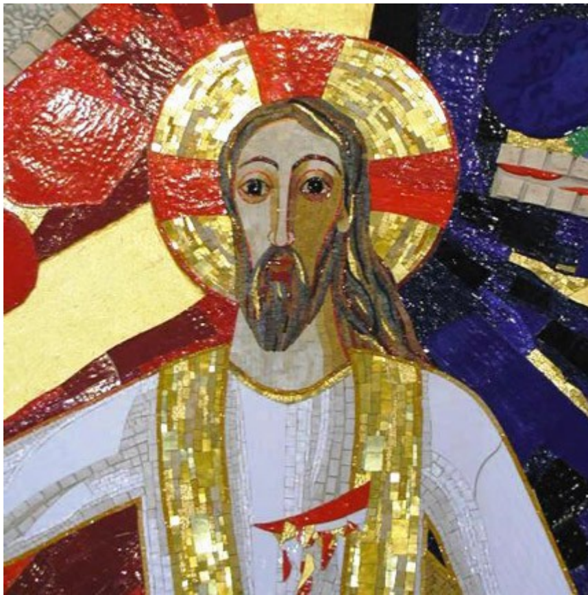
Slika 1: Vstali in povelčani Kristus