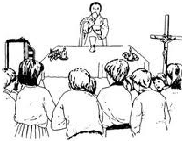
Slika 4: Sveta evharistija

Beseda evharistija (pa tudi obhajilo) lahko pomeni sam zakrament, lahko pa tudi kruh (hostijo) in vino, ki ju verniki prejemajo pri tem zakramentu.