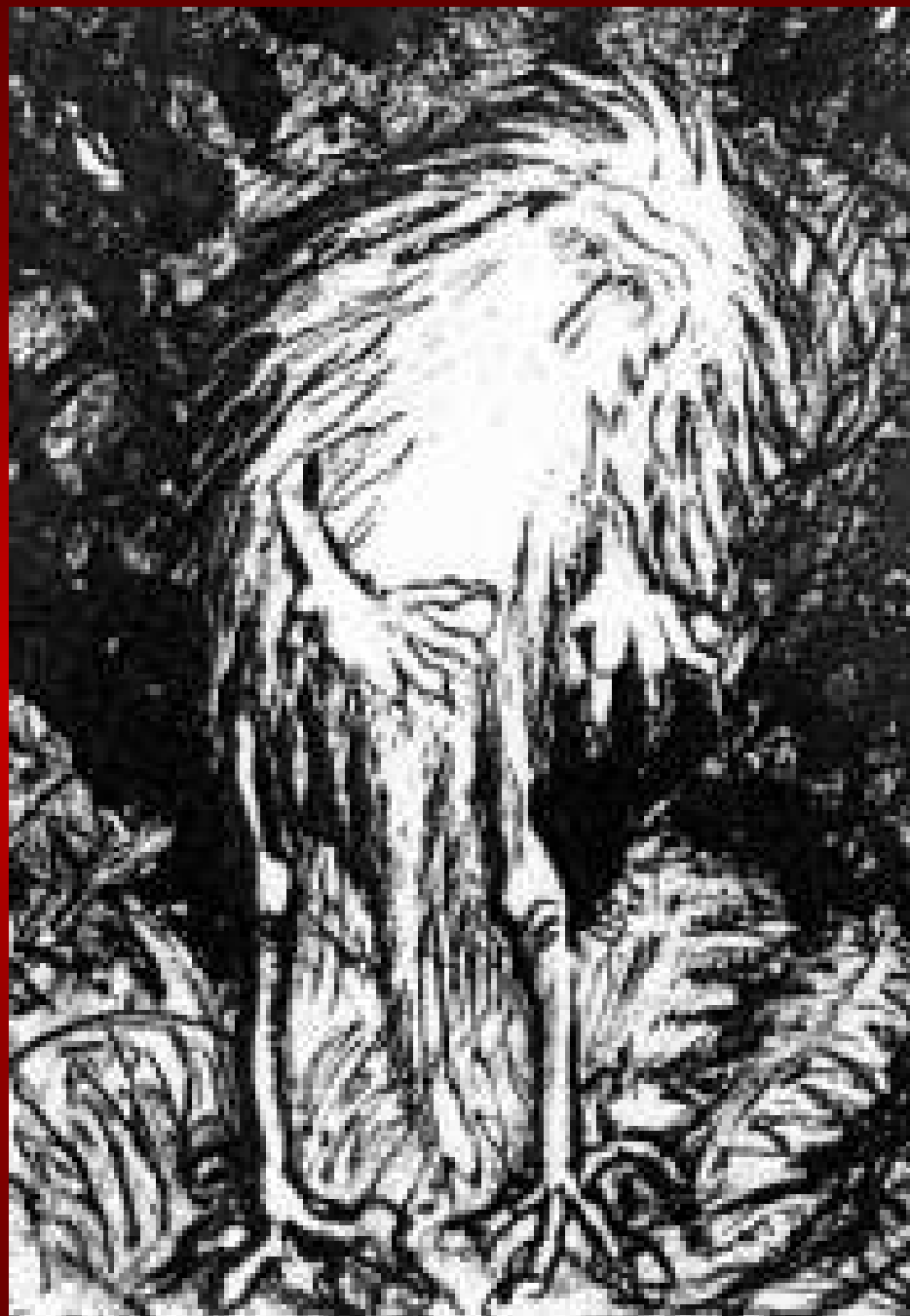
Leši, gozdni duh