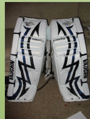
vratarjevi nožni ščitniki