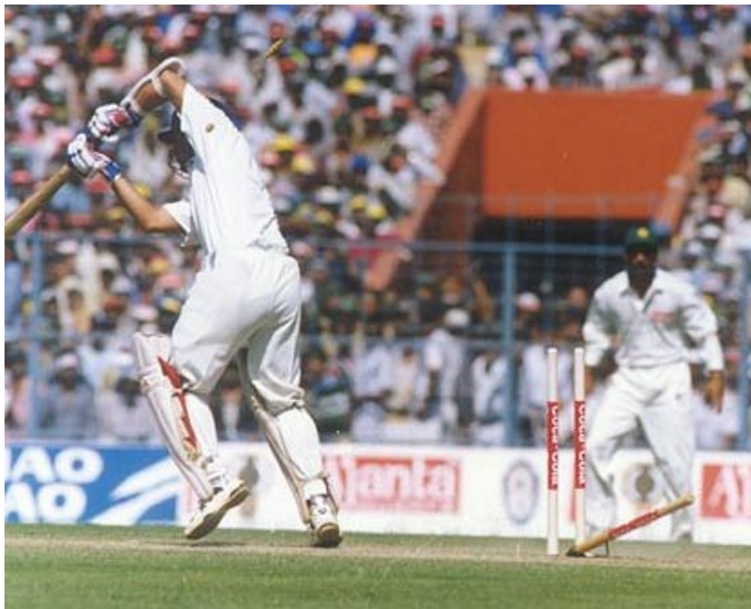
Vrata so podrta