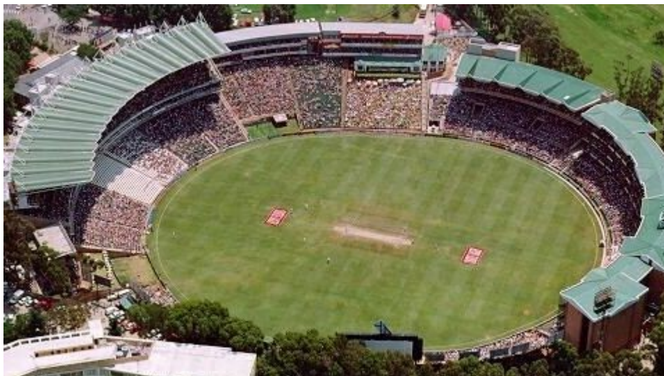
Igrišče za kriket