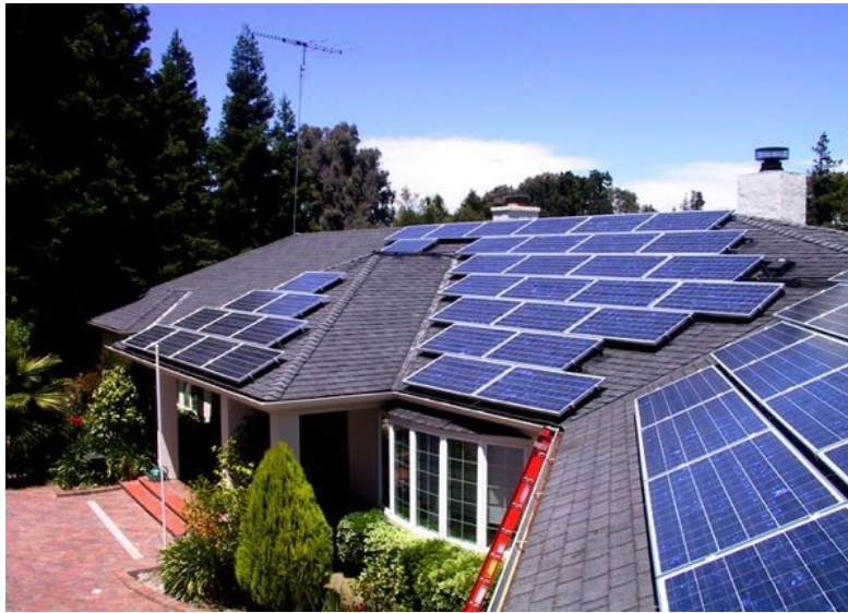
Slika 3: Kolektorji

Posebni ploščati visokotemperaturni sprejemniki sončne energije so inštalirani na strehi sosednjega objekta KIV d.d.. KIV d.d. je podjetje, ki je specializirano za proizvodnjo večjih kotlov na lesno biomaso (od 1 MW do 27 MW), proizvodnjo sežigalnic in zalogovnikov. Toplotna energija, proizvedena iz sprejemnikov sončne energije se preko delno podzemnih predizoliranih cevi transportira do solarne podpostaje in nato dalje do daljinskega ogrevanja kraja Vransko. V solarni podpostaji sta solarni krog in toplotni krog povezana preko toplotnega izmenjevalca. Postrojenje je bilo dimenzionirano za maksimalno kapaciteto 1 MW solarnega sistema (1500 m 2 ), ki se bo nadgradil v prihodnje.