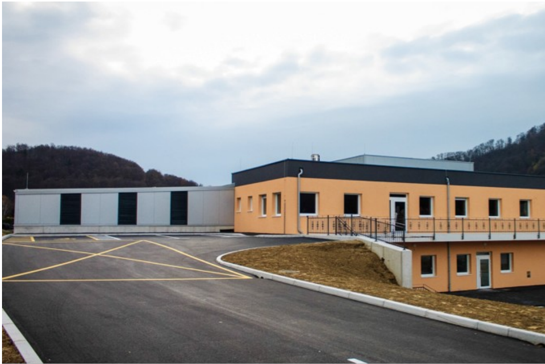
Slika 1: Toplarna Kozje iz sprednje strani