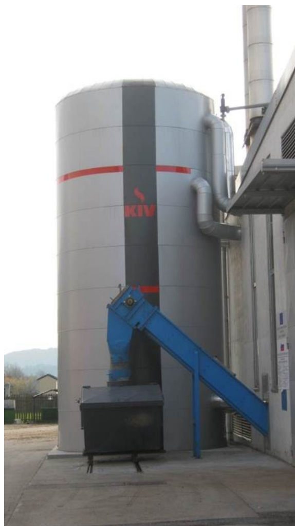
Slika 2: Zalogovnik

V sklopu Slovensko avstrijskega konzorcija so končali prvi solarni daljinski sistem v Sloveniji. Sprejemniki sončne energije s površino 842,3 m 2 preko zalogovnika s prostornino 93 m 3 zagotavljajo energijo sistemu daljinskega ogrevanja na lesno biomaso Vransko. Do nedavnega so toplotno energijo proizvajali s pomočjo dveh biomasnih kotlov (1,2 MW in 2 MW). Skupaj z investicijo v sprejemnike sončne energije pa so inštalirali tudi zalogovnik velikosti 93 m 3 .