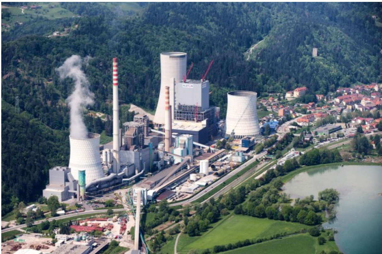
Slika 1: Termoelektrarna Šoštanj