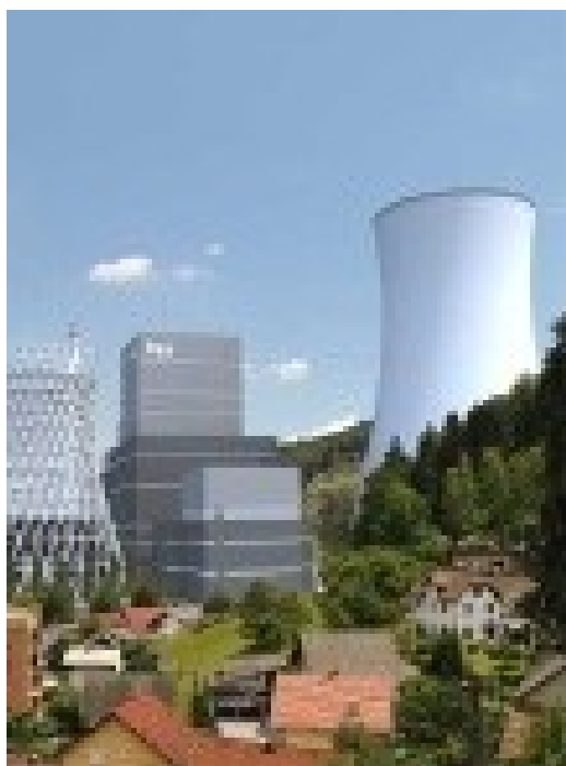
Slika 5: Blok 6 termoelektrarne Šoštanj

Za gradnjo bloka 6 v Termoelektrarni Šoštanj so se odločili zaradi znižanja cene električne energije, znižanja ekološke obremenjenosti okolja, znižanja prahu, hrupa... Eden glavnih razlogov pa je bilo podaljšanje proizvodnje električne energije, ki jim jo omogoča količina premoga iz Premogovnika Velenje iz 2025 na leto 2054.