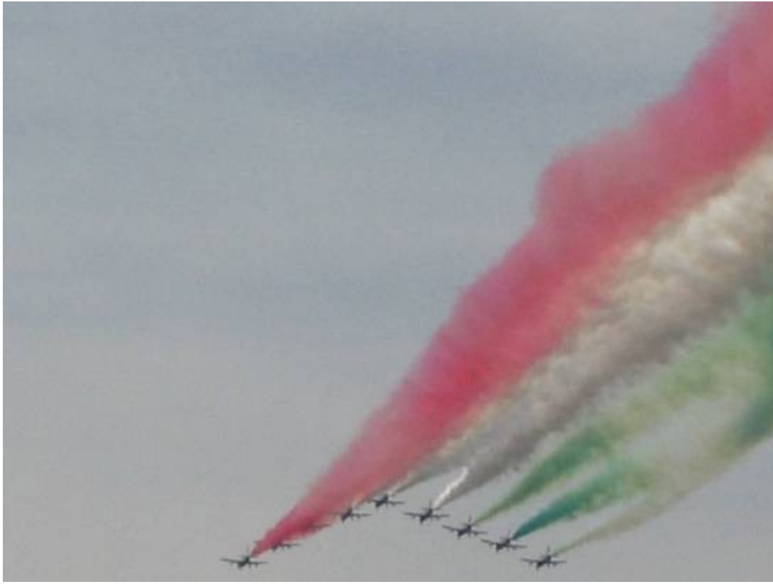
Slika 6:FRECCE TRICOLORI