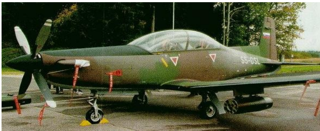
Slika 1: PILATUS PC - 9

Avstrijska vojska uporablja prejšnji model PC-7, za PC-9 pa se je odločila tudi sosednja Hrvaška, ki naj bi jih imela skupaj 20.