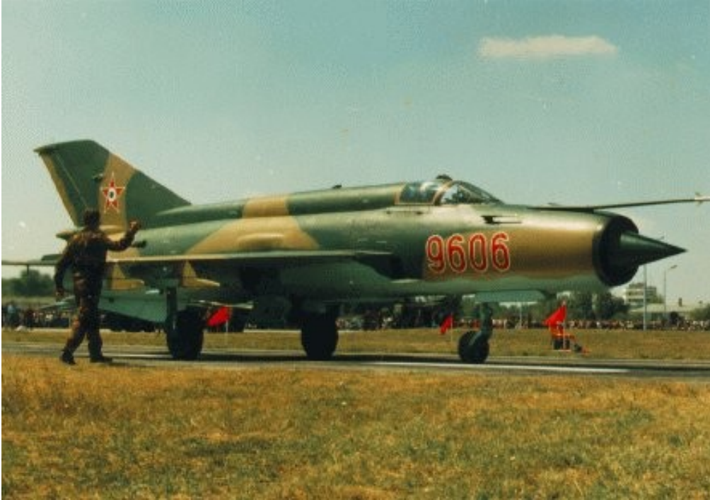
Slika 3: MIG 21 - FISHBED