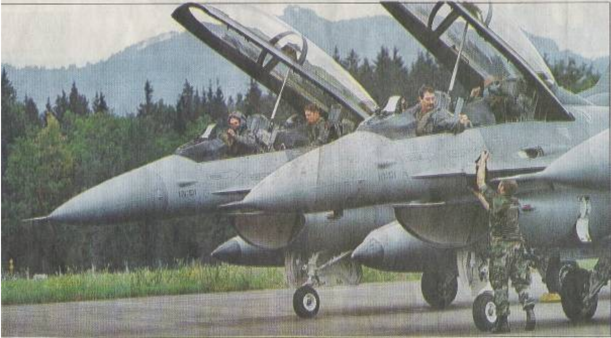
Slika 2: F-16 FIGHTING FALCON