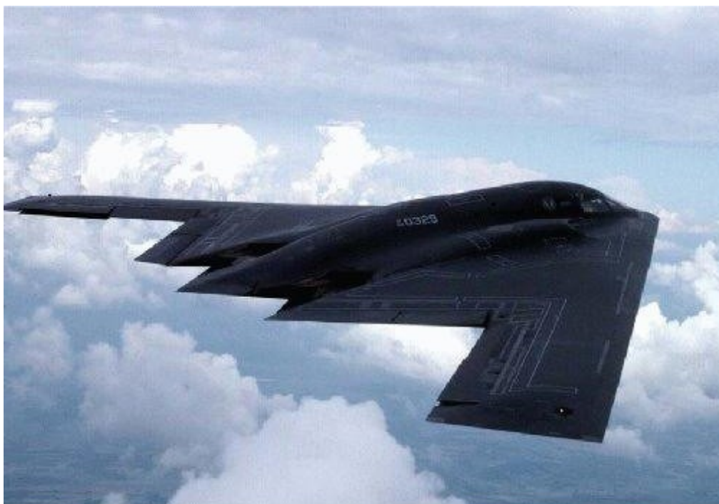
Slika 5: B-2 NORTHROP

posadko. B-2 je prvič vzletel julija 1989, zgrajen je z dobršnega dela kompozitnih materialov. Zasnovan je kot leteče krilo brez vertikalnih površin, puščica krila je 40^\circ , zadnji rob pa ima obliko dvojne črke W. Čeprav so jih sprva načrtovali kar 132, so zaradi izredno visoke cene skupno število zmanjšali na okoli 20. današnja verzija nosi oznako B-2B, prve primerke B-2A pa bodo izpopolnili v standard – B. Bombnik preleti Atlantik v približno devetih urah z vmesnim oskrbovanjem goriva.