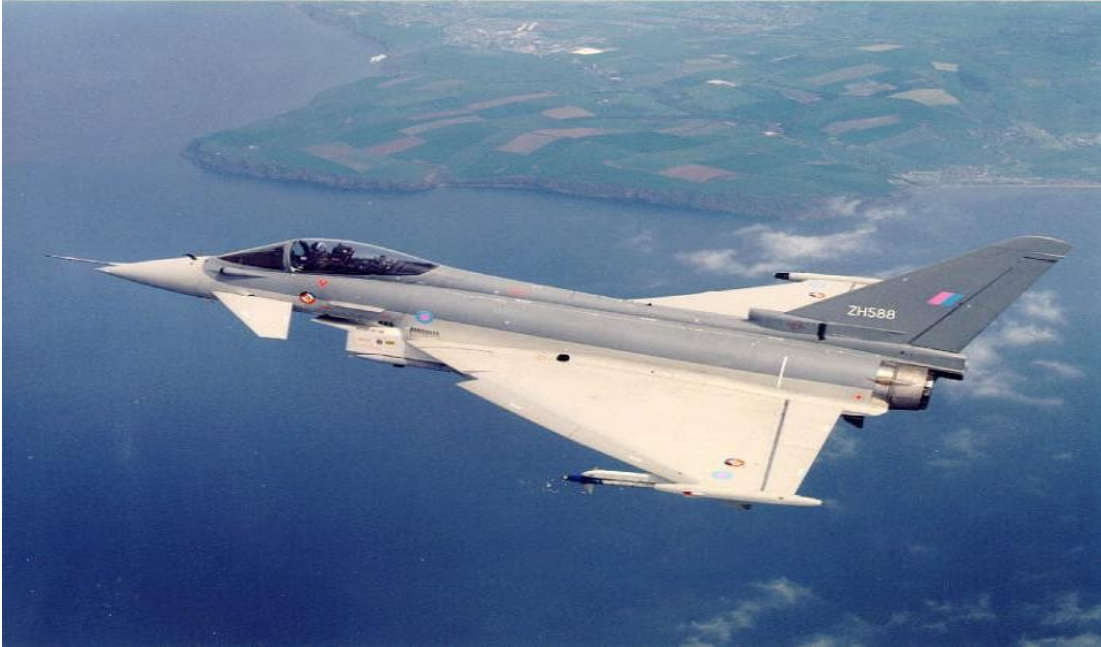
Slika 4: EUROFIGHTER