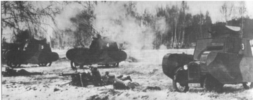
urjenje nemških vojakov

Nemčija je I. svetovno vojno izgubila. Številčnost njenih oboroženih sil in oprema slednjih je bila omejena. Toda v nemški vojski so ostali le najboljši. Mnogi znani tankisti so se urili in usposabljali prav v tem obdobju (npr. Guderian). Nemška vojska je bila prisiljena v improvizacijo zaradi omejitev, ki jim jih je povzročil poraz v prvi svetovni vojni (slika).