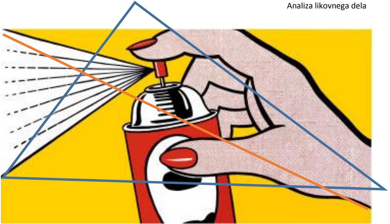
Roy Lichtenstein, Spray Can