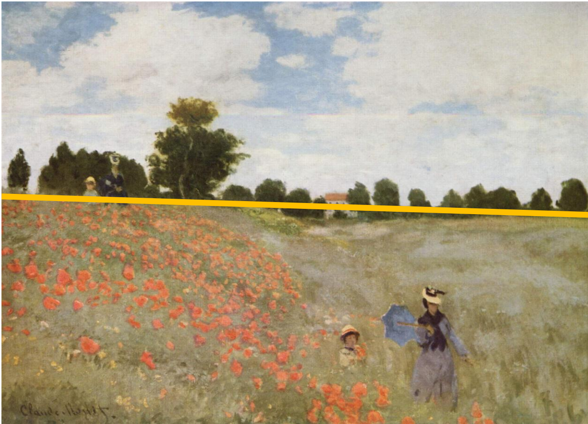
Claude Monet, Mak