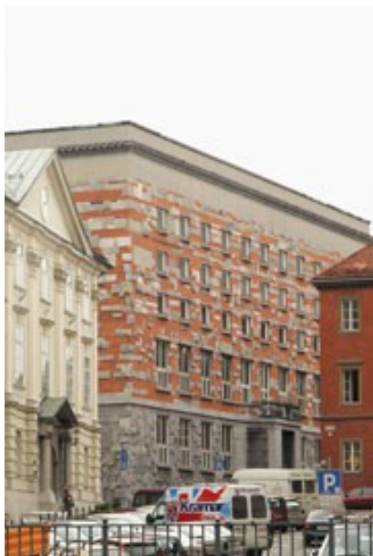
Slika 10: Jože Plečnik – NUK