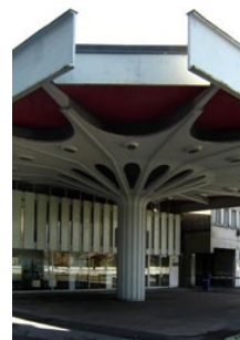
Slika 20: Bencinski servis Petrol