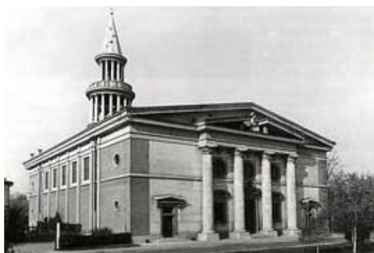
Slika 12: Plečnikova cerkev v Šiški