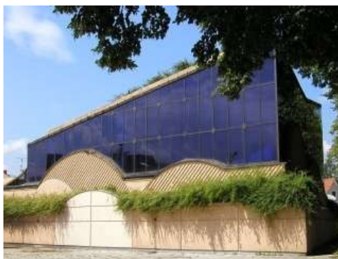
Slika 22: Draveljska cerkev

Kljub nenavadnosti in očitnem podiranju konvencionalnih predstav o sakralnem prostoru, je arhitekta vodilo jasno prepričanje, kakšno cerkev mora zasnovati. Mušič je dejal, da: »mora biti zgradba božje hiše preprosta, morda celo skromna, vendar nikakor prostorsko siromašna« 1 , in ta, netradicionalna, če ne celo »čudna« cerkev, tudi v resnici je.