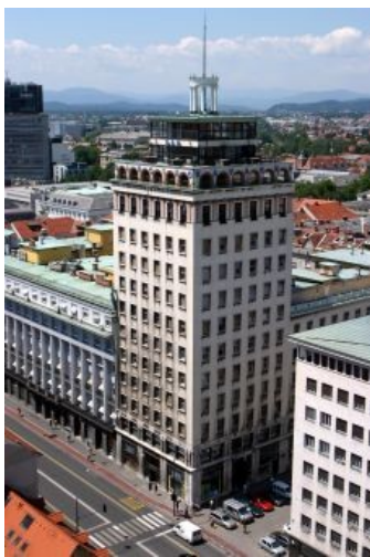
Slika 22: Ljubljanski Nebotičnik

Nebotičnik sledi zamisli vertikalnega mesta: trgovine so segale v prvo nadstropje, sledili so poslovni prostori in stanovanja, na vrhu pa je bila kavarna z razgledno teraso. V pritličju je monumentalna veža, ki vodi do spiralnega stopnišča. Zgradba je bila opremljena po vseh modernih vzorih, od modernega pohištva do hitrih dvigal in klimatskih naprav. Nebotičnik je ena najprepoznavnejših ljubljanskih stavb in še danes močno zaznamuje to mesto. Še vedno je tudi simbol stremljenja po napredku in svetovljanskosti.