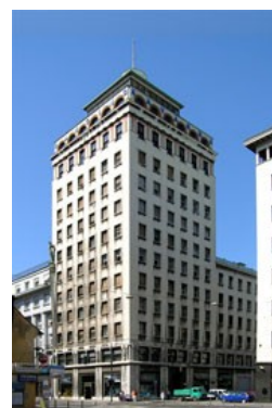
Slika 9: Ljubljanski nebotičnik