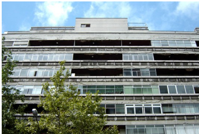
Slika 24: Kozolec

Kozolec je postavljen na glavno ljubljansko ulico, arhitekt Edo Mihevc pa ga je zasnoval po načelih mestne palače, kar pomeni da je ulična fasada drugačna od dvoriščne. Stanovanja so bila za tisti čas vrhunska, v njih pa so prebivali le premožnejši ljudje. Kljub temu, da je Kozolec skromnejša različica L'Unité d'habitation je s svojo dolžino (93m) in višino (10 nadstropij) izstopal iz meril tedanje stanovanjske arhitekture.