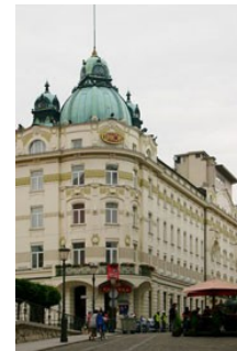
Slika 5: Hotel Union