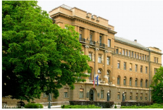
Slika 1: Sodišče v Ljubljani