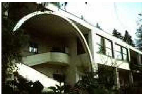
Slika 13: Tomažič - Vila Oblak