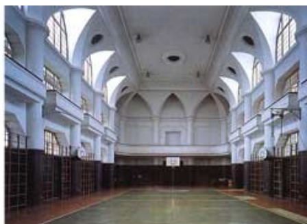
Slika 7: Notranjost Sokolskega doma