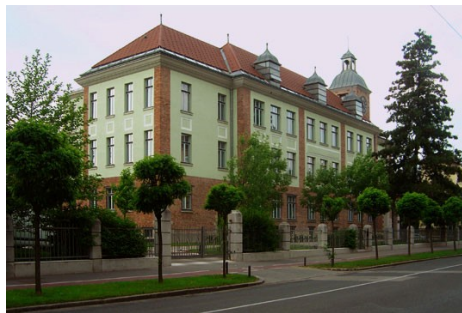
Slika 4: Mladika