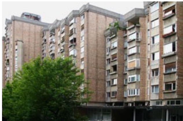
Slika 18: Ferantov vrt