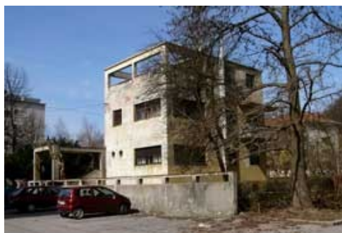
Slika 14: Tomažič - Vila Grivec