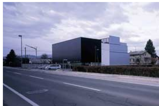
Slika 22: Arcadia Lightwear