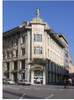
Slika 2: Centromerkur

1 Različni avtorji: 20.stoletje: arhitektura od moderne do sodobne: vodnik po arhitekturi, Zavod za varstvo kulturne dediščine Slovenije, 2001, stran 45