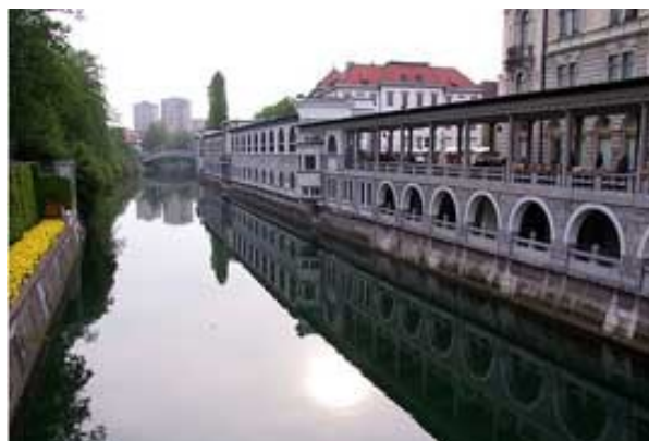
Slika 11: Plečnikova tržnica