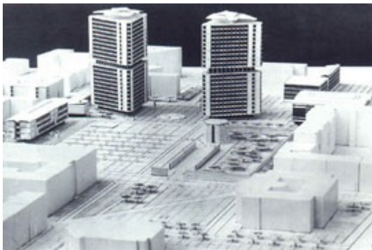
Slika 17: Trg republike

Proti koncu desetletja se začnejo graditi kompleksnejše, mestne polifunkcionalne stavbe, kot so Plava laguna arhitekta Usenika, Klinični center arhitekta Stanka Kristla in najpomembnejši Ravnikarjevi deli: poslovni stanovanjski kompleks Ferantov vrt (1966-1968) ter trgovsko poslovni kompleks Trg revolucije, danes Trg republike (1960-1984). Ta kompleksa sta med glavnimi »dejanji«, ki so spremenila Ljubljano.