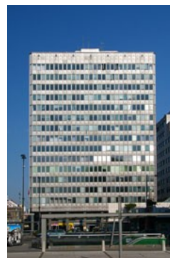
Slika 16: Metalka