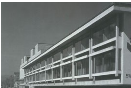
Slika 19: S. Sever- Tiskarna Mladinska knjiga

1 Različni avtorji: 20.stoletje: arhitektura od moderne do sodobne: vodnik po arhitekturi, Zavod za varstvo kulturne dediščine Slovenije, 2001, stran 62