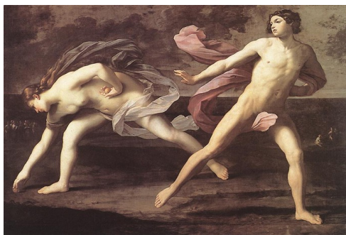
SLIKA: Atalanta in Hipomenes To veliko platno sekata prekržani diagonali, komponirano pa je v prekinjenih in spet nadaljevanih ritmih. Renijev ljubki klasicizem se je poigral z manierističnimi prvinami.

Razvijal se je pod vplivom manierizma in Carraccija. V svojem času je veljal za Rafaelovega tekmeca in odličnega mojstra. Kot umetnik, ki je veliko razmišljal, se je bil sposoben po lastni presoji in z veliko umerjenosti prilagoditi različnim vplivom in izoblikovati lastno klasicistično pojmovanje Caravaggievega sloga, kar je razvidno na sliki Križanje sv. Petra. Njegove velike rimske freske z bogovi Olimpa dosegajo vrhunec v Avrori za casino Rospigliosi, medtem ko v reinterpreteraciji renesanse doseže s Pokolom nedolžnih otrok, v Atalanti in Hipomenu, ki je v Pradu, in v Herkulovih junaštvih, naslikanih za Gonzage. Prva dela z versko tematiko so blizu Marillu, medtem ko različne slike Magdalene kot vanitas izpričujejo nekakšen vznemirljiv podton, opažen že v nedosegljivem mojstrstvu Davida z Goljatovo glavo iz Louvra.