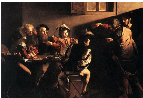
SLIKA: Poklicanje sv. Mateja Platno prikazuje trenutek, ko Jezus nenadoma pokliče carinika Mateja.