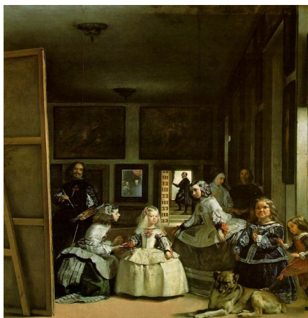
SLIKA: Las Meninas Mojstrovina baročnega prostorskega iluzionizma.

izučil se je v delavnicah sposobnih mojstrov, kot sta bila Francisco de Herrera in Francisco Pacheco. Leta 1622 in leto potem je na dvoru, kjer je po zaslugi vojvoda Olivaresa, ki je občudoval njegovo delo, postal komorni slikar. Leta 1629 je bil v Italiji, kjer je obiskal glavna umetnostna središča, od Genove do Neaplja. Bil je zelo uspešen slikar, in čeprav do Caravaggievega nauka ni bil navdušen, je umirjal svoj realizem in nenehno nadzoroval estetske kakovosti kompozicije in harmonično skladnost barvnih con. Prav zaradi popolne, uravnovešene in čvrste uporabe barv, zaradi močnih in zgovornih potez čopiča, se je razvil v mojstra, neodvisnega od različnih modnih smeri, čudovito treznega slikarja velikega teatre baročnega sveta. Njegovo slikarstvo ostaja kot spomenik, s katerim so se merili umetniki vse do danes.