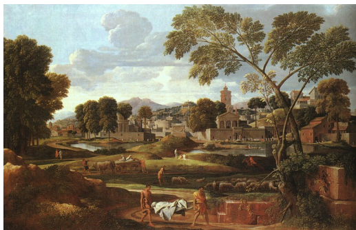
SLIKA: Pokrajina s Fokionovim pogrebom Klasističen prikaz narave z redko posejanimi stavbami prevladuje nad zgodovinskim dogodkom, ki je žalosten in v podrejenem položaju, čeprav je naslikan v prvem planu.

razmišljanju ter iskanju racionalne jasnosti in arheološke natančnosti (Ugrabitev Sabink). Po kratkem bivanju v Parizu, kamor so ga poklicali leta 1640, se je leta 1642 spet vrnil v Rim in pustil poslikavo dekoracije Velike galerije v Louvru nedokončano. Iz njegovega zadnjega obdobja so prekrasne pokrajine, ki so postale vzor neoklasicistične kulture (Pokrajina s Polofemom, Ermitaža, Sankrt Peterburg). Poussinova osebnost in delo zaznamujeta začetek pojmovanja sloga kot vrednosti same po sebi, ki ga še danes zasledimo v francoski izrazni kulturi. V romantičnem obdobju je Poussinov sloves žal zbledel.