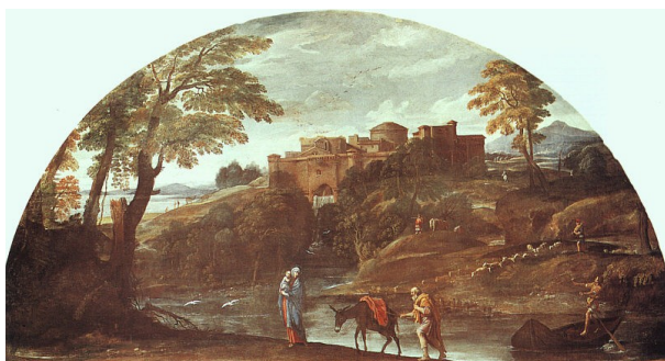
SLIKA: Beg v Egipt Slika že napoveduje Poussinov in Lorrainove krajine.

Še zelo mlad prisostvuje ustanovitvi Accademie dei Desiderosi v Bologni. V Rim je prišel leta 1595, kjer je poslikal galerije v palači Farnese po kompozicijskih rešitvah, ki jih je prevzel z Michelangelovega obokanega stropa v Sikstinski kapeli in po Rafaelovih freskah v Farnesini. V farneškem ciklu, posvečenem ljubeznim bogov, je z detajlnejšo analizo narave resničnosti izrazil svojo interpretacijo Correggievega čutnega in evokativnega sloga. Ob tem je dozorel in zaključil obdobje, ki ga je z bratom Agostinom in bratrancem Ludovicom začel na Akademiji delgi Incamminati v Bologni. Annibalovo poetičnost zaznamo v nenehnem iskanju lepotnega ideala, ubrano zlitega z naravo v veličastnosti, za katero je navdih dobil pri klasičnih antičnih in sodobnih zgledih.