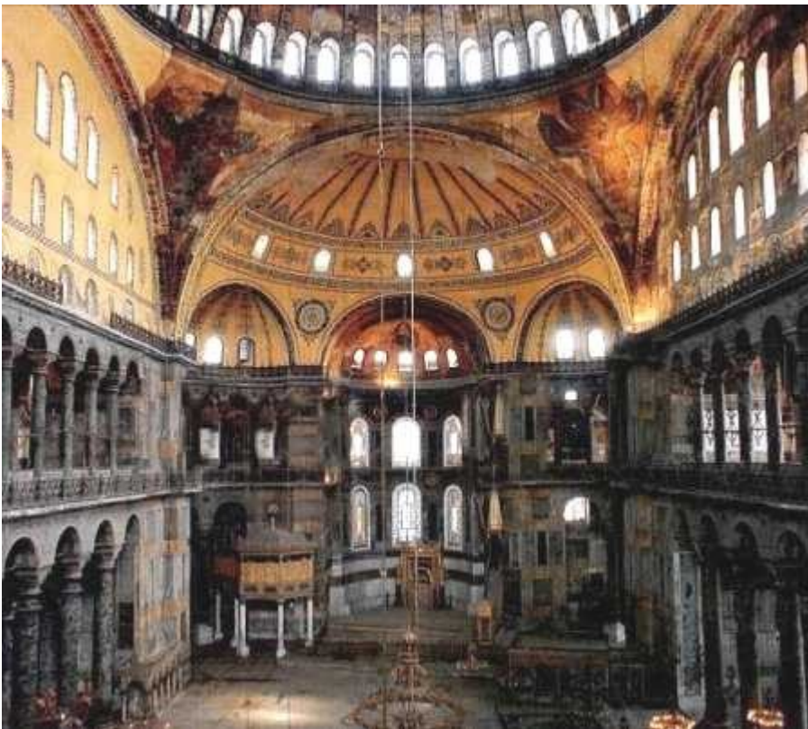
Hagia Sophia, notranjost