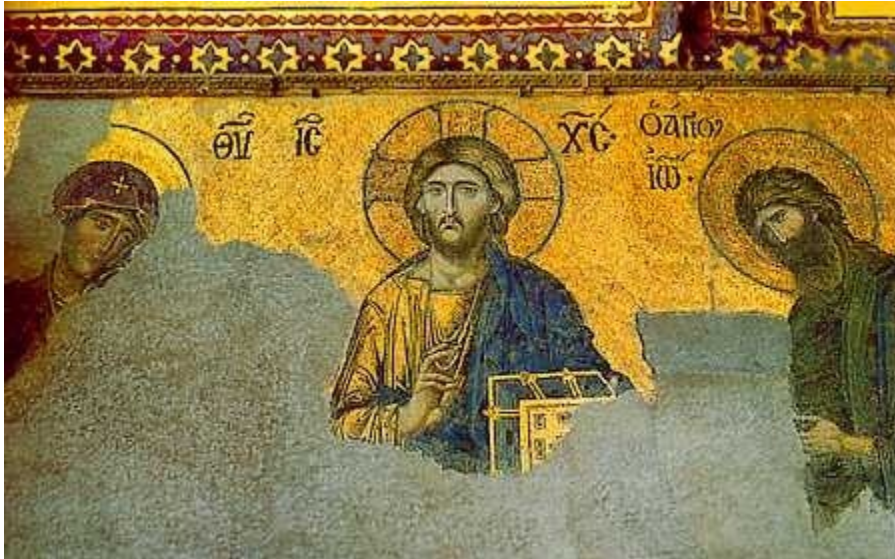
poslikava v Hagii