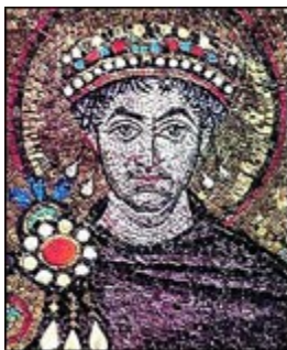
Cesar Justinijan, Hagia Sophia, mozaik