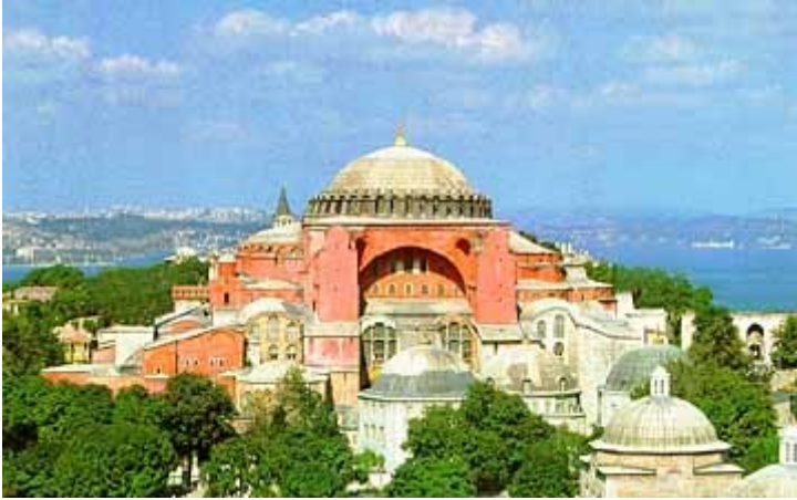
Hagia Sophia, zunanjost