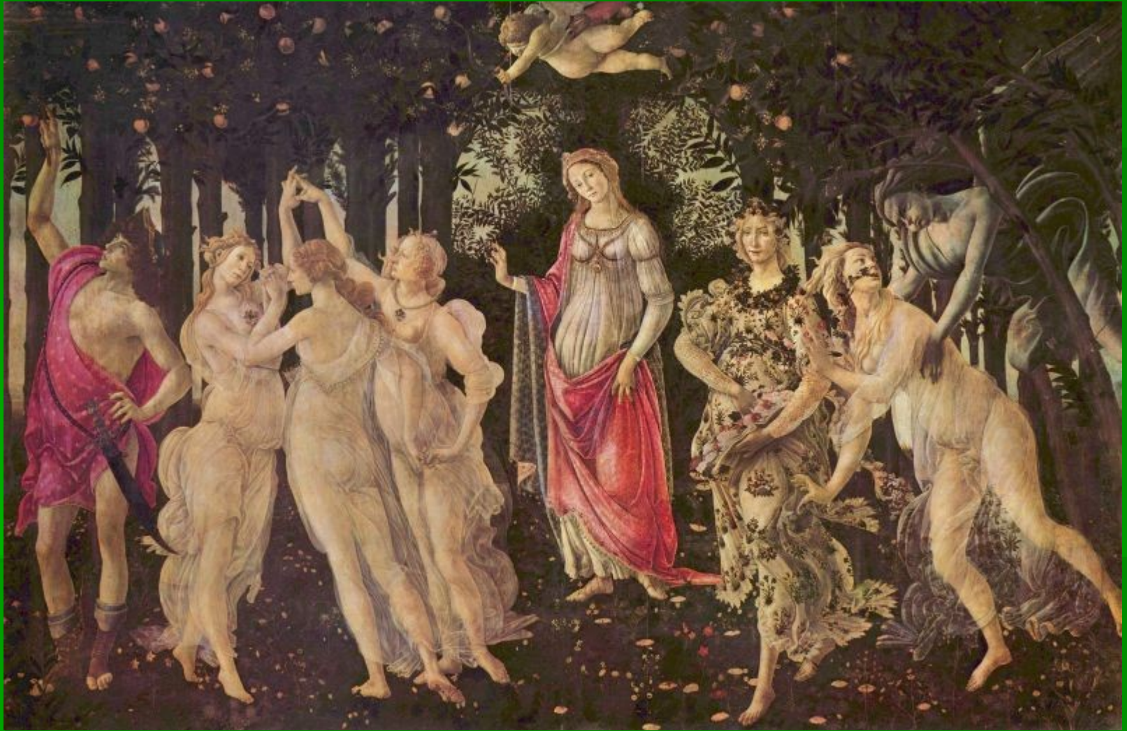
Sandro Botticelli, Pomlad , 1482, 315 x 205 cm , Tempera, Uffizi-Firence