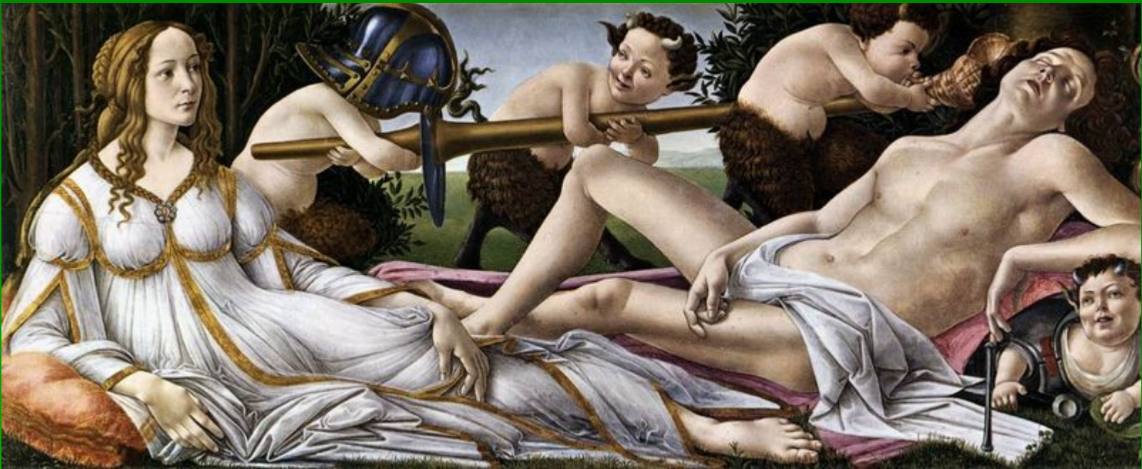
Sandro Botticelli, Venera in Mars , 1483, 69 x 173 cm, National Gallery, London.

Na sliki se pred našimi očmi simbolično odigrava zmaga ljubezni na golo silo