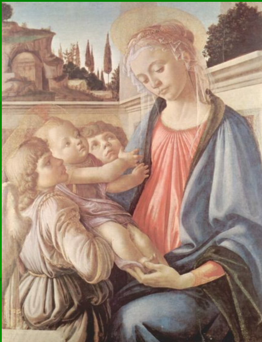
Sandro Botticelli, Marija in otrok z dvema angeloma , 1468-1469, 100 × 71 cm , Neapelj