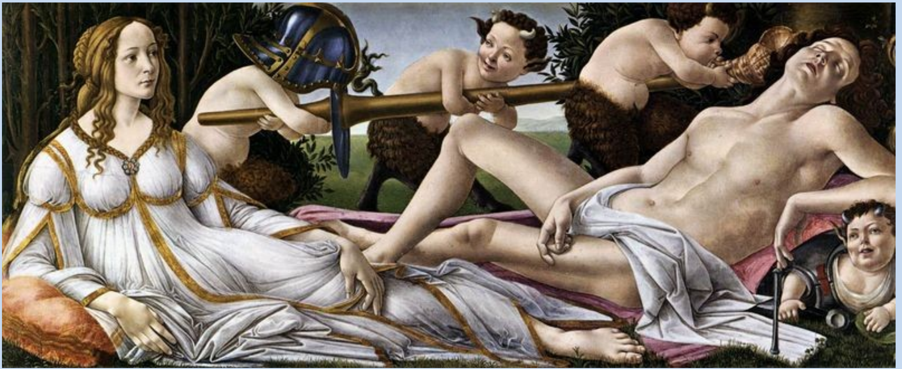
Sandro Botticelli, Venera in Mars , 1483, 69 x 173 cm, National Gallery, London.

Moč ljubezni premaga fizično moč bojevnika.