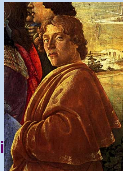
Botticelijev avtoportret(detajl s slike Poklon sv. Treh kraljev 1475, Uffizi,Firence

- Leta 1470 je ustanovil svojo lastno delavnico, v kateri se je izučil tudi sin njegovega nekdanjega učitelja, Filippino Lippi