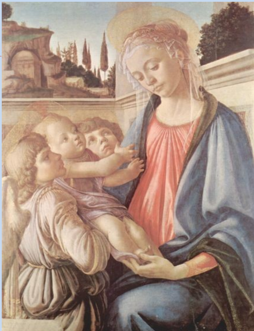
Sandro Botticelli, Marija in otrok z dvema angeloma , 1468-1469, 100 × 71 cm , Neapelj