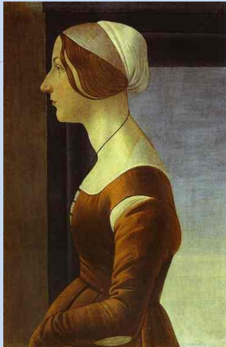
Portrait of a Woman. c.1475. Tempera na les. Palazzo Pitti, Galleria Palatina, Firenze, Italija

▶ Fortitude. c.1470. Tempera na les. Galleria