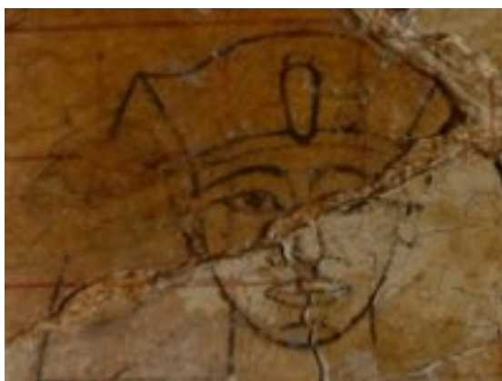
Slika 3. faraon Tuthmosis III ali njegova mama Hatsheps

Davni Egipčani so portrete faraonov običajno delali iz profila, izjema so bile podobe sovražnikov, tujcev in nenavadnih bitij.