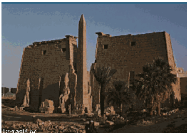
Slika 7: tempelj iz Luksorja

da za svetišča uporabljajo namesto lesa kamen (zaradi njegove trdnosti in obstojnosti ta razlika ni zgolj funkcionalna, temveč tudi simbolna).