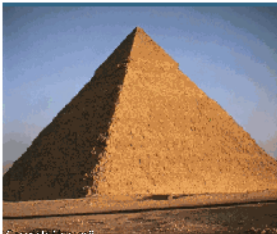
Slika 6: Keopsova piramida

Piramide so monumentalne grobne stavbe egipčanskih vladarjev in imajo simboličen pomen. Najbolj znane so piramide pri Gizi, pred katerimi stoji mogočna sfiinga.