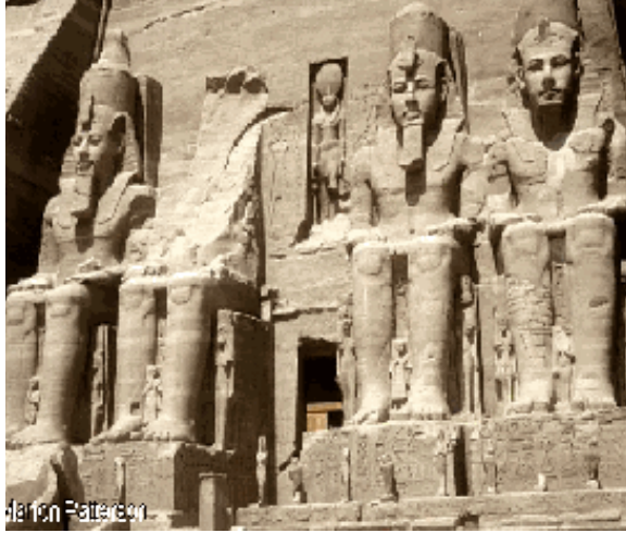
Slika 5: prikazuje Abu Simbel tempelj v Luksorju, kateremu je Ramzes II. (13. st. pred našim štetjem) dodal spredaj štiri velikanske kipe samega sebe.