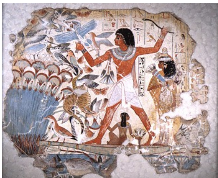
Slika 1. Nebamun

Na sliki je Nebamun, ki stoji na papirusnem čolnu, spremljata pa ga žena in hčerka. Čeprav je oplnil tri čaplje, v drugi roki vihti bumerang. Napis nam pove da gre za pogled na dogodek, ki se dogaja v posmrtnem življenju.