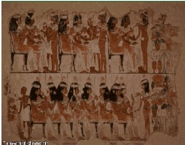
Slika 2. banquet

bila določena nespremenljiva barvna lestvica, nič manj pa za hieroglife. Tako je bila polt moških vedno rdečkasto obarvana, polt žensk pa rumenkasto. Voda je bila modre barve in rastlinje zelene barve. Rumena je pomenila večnost, zelena pa rodovitnost. V nekropolah se je okras podredil kultu mrtvih: naslikali so vse darove ki so jih v resnici prinesli ranjenemu v grobnico in so bili namenjeni njegovemu posmrtnemu življenju, ki naj bi mu teklo čimbolj udobno in nemoteno.