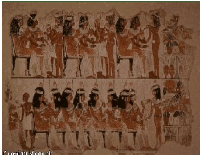
Slika 2. banquet

poslikavo, za katero je bila določena nespremenljiva barvna lestvica, nič manj pa za hierogliffe. Tako je bila polt moških vedno rdečkasto obarvana, polt žensk pa rumenkasto. Voda je bila modre barve in rastlinje zelene barve. Rumena je pomenila večnost, zelena pa rodovitnost. V nekropolah se je okras podredil kultu mrtvih: naslikali so vse darove ki so jih v resnici prinesli ranjenemu v grobnico in so bili namenjeni njegovemu posmrtnemu življenju, ki naj bi mu teklo čimbolj udobno in nemoteno.