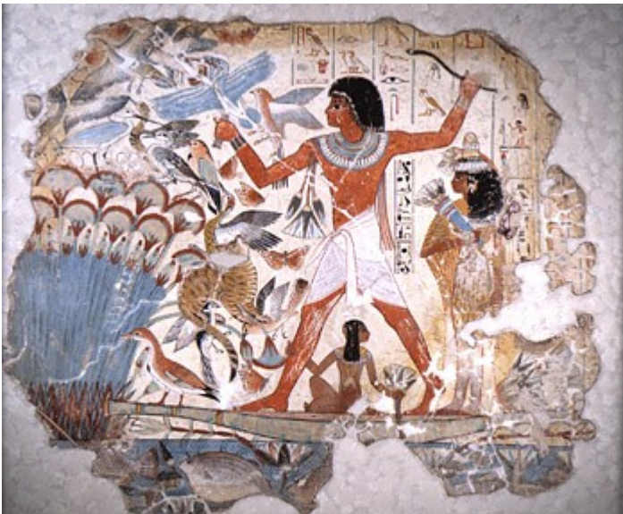
Slika 1. Nebamun

Na sliki je Nebamun, ki stoji na papirusnem čolnu, spremljata pa ga žena in hčerka. Čprav je oplenil tri čaplje, v drugi roki vihti bumerang. Napis nam pove da gre za pogled na dogodek, ki se dogaja v posmrtnem življenju.