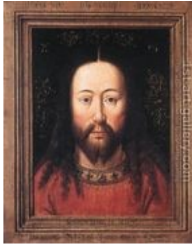
Slika 1: Portret Kristusa, 1440, olje na lesu, 33.4 x 26.8 cm

Slika 1: Krížanje in poslednja sodba, 1420-1425, olje na lesu, 56.5 x 19.5 cm (vsaka posebej)