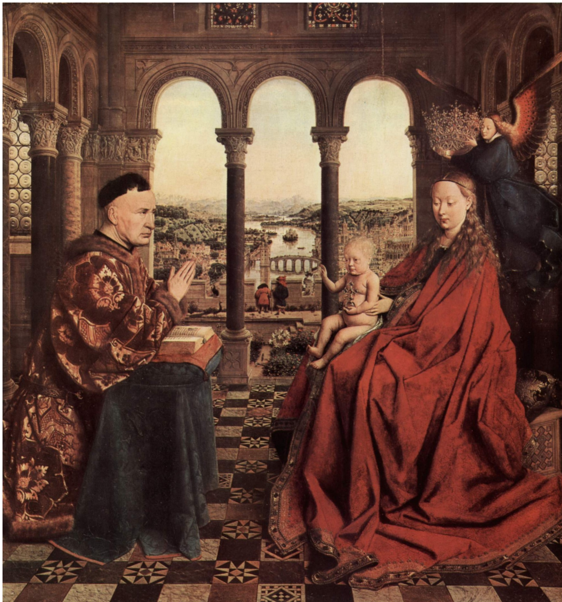
Slika 1: Mati božja kanclerja Rolina, 1435, olje na lesu, 66 x 62 cm

V nekaterih ozirih je to slikarsko delo nadaljnja razvojna stopnja Van Eyckovega realizma. Vidimo, da na sliki prevladujejo različni odtenki rjavkaste barve, rdeča, pa tudi modra. Osebe so pod enotnim virom svetlobe, ki prihaja z zgornje desne strani, kompozicija pa je simetrična in linearna, delno pa je že tudi vidna zračna perspektiva. Slika ima 2 plana. 1. plan sta kancler, Marija, Jezušček in veranda, 2. plan pa vrt, ki se razteza za arkadami.