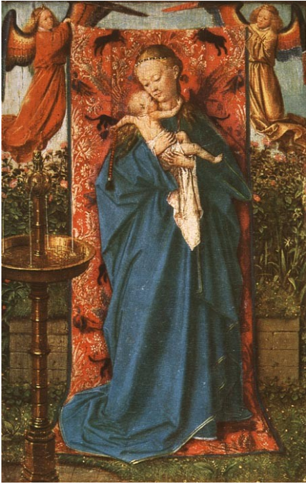
Slika 1: Madona in otrok pri fontani, 1439, olje na lesu, 19 x 12 cm