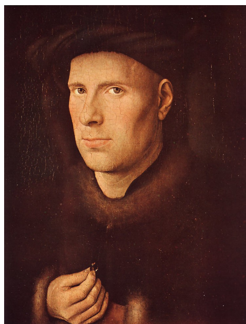
Slika 1: Portret Jana de Leeuwa, 1436, olje na lesu 24.5 x 19 cm