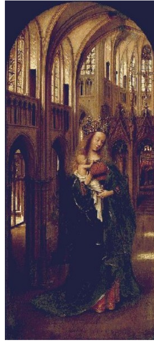
Slika 1: Madona v cerkvi, 1425, olje na lesu, 32 x 14 cm