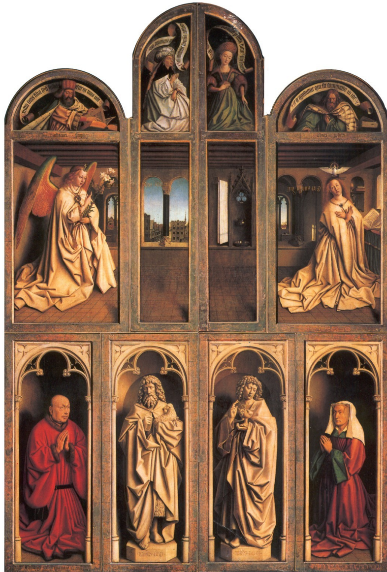
Slika 1: brata van Eyck, Gentski oltar (zaprt) , Gent, cerkev sv. Bavona, 1432, olje na panelu*

Ko je zaprt, nam kaže dvanajst na hrast poslikanih polj, ki se dodatno delijo v tri vrste. Na celotnem delu vidimo osebe iz svetega pisma, preroka, sibili, donatorja in njegovo ženo. Čeprav je bil oltar poslikan v obdobju renesanse, je še vedno viden vpliv gotike v gubah pri draperijah in gotskem krogovičju.