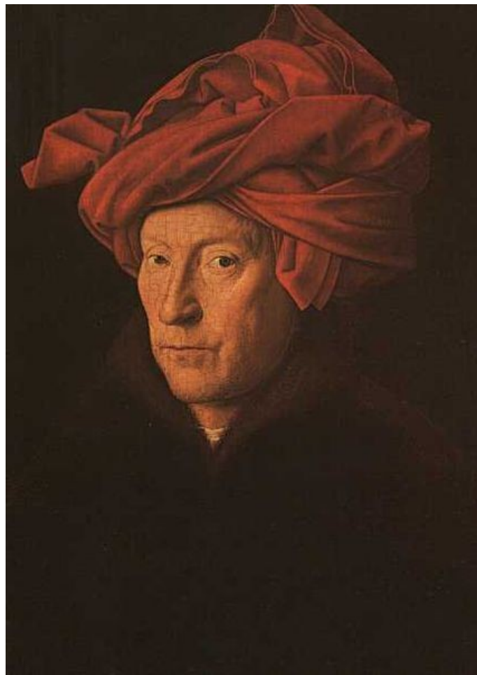
Slika 1: Portret moža s turbanom, 1433, olje na lesu, 15,5 × 19 cm

Jan van Eyck ali Johannes de Eyck se je rodil okoli leta 1390 v Maaseycku pri Maastrichtu, blizu mesta, ki leži na meji med Belgijo in Nizozemsko. Leta 1422 je bil v službi holandskega grofa Janeza III. bavarskega, pri katerem je do 1424 poslikal rezidenco v Haagu, od leta 1425 do 1429 pa je postal dvorni slikar in diplomat vojvode Filipa Dobrega. Za njega je večkrat potoval v službenih misijah, med drugim je leta 1428 z vojvodovim poslanstvom šel snubit in slikat infantinjo* Isabello, hčer portugalskega kralja, s katero se je Filip Dobri kasneje tudi poročil. Po tem potovanju se je leta 1430 naselil v Bruggu, kjer je umrl 9. julija 1441. Pokopan je bil v cerkvi Sv. Donata v Bruggeju, ki pa je bila uničena v Francoski revoluciji.