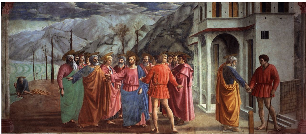
Slika 1: Masaccio, Davčni novčič , 1420, freska, 247 × 597 cm

Če primerjamo pokrajino iz prizora Apokaliptičnega Jagnjeta in pokrajino iz Masaccijeve slike Davčni novčič, ki sta bili naslikani v zgodnji renesansi, opazimo razlike. Pri Masaccievi sliki vidimo, da je pokrajina pusta, zelo gorata, z malo zelenja in brez življenja. Z njo je želel poudariti ozračje, ki je vladalo med figurami. Pokrajina iz Jan van Eyckovega Gentskega oltarja se medtem šibi od rodovitnosti in zelene barve, ki sliko napolni z življenjem, narava zapolni celotno sliko ter nam daje občutek, da izginja v daljavi.