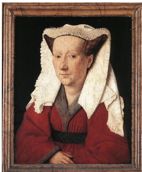
Slika 1: Portret Margarete van Eyck 1439, olje na lesu 32.6 x 25.8 cm