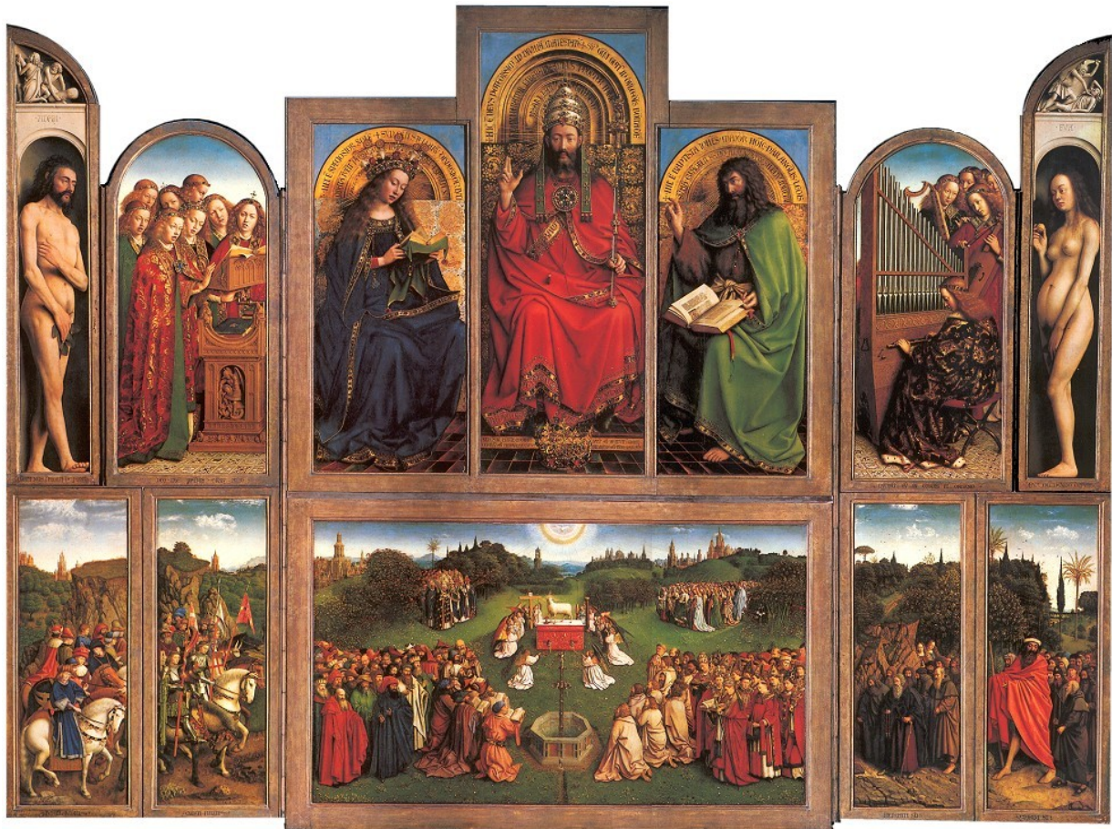
Slika 1: brata van Eyck, Gentski oltar (odprt) , Gent, cerkev sv. Bavona, 1432, olje na panelu*

Ko je odprt, so slike deljene v dve vrsti. V zgornji vrsti so osebe iz svetega pisma, razporejene okrog božjega prestola, v spodnji vrsti pa so številne gruče okrog apokaliptičnega Jagnjeta. Tudi tukaj je viden vpliv gotike v gubah pri draperijah.