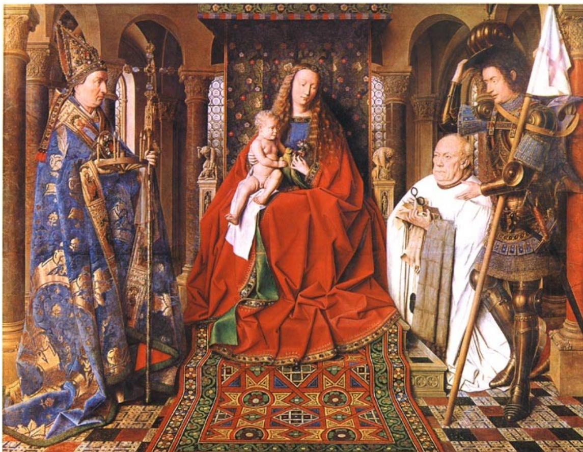
Slika 1: Marija s Kanonikom van der Paele, 1436, olje na lesu, 122 x 157 cm