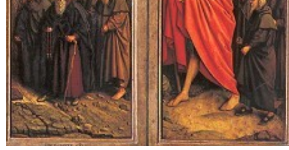
leva stran glavnega prizora