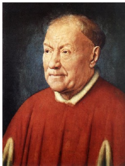
Slika 1: Portret kardinala Nicolla Albergatija 1435, olje na lesu 34 x 27.5 cm