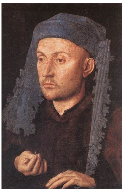
Slika 1: Portret zlatarja, 1430, olje na lesu 16.6 x 13.2 cm