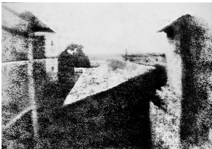
Najstarejša ohranjena fotografija iz leta 1826: Pogled iz okna na posestvo, avtor Joseph Nicéphore Niépce

O nastanku fotografije kroži veliko zgodbic, vendar je najbolj zanimiva tista, ki jo je objavil človek po imenu de la Roche v svojem delu Giphantie leta 1741. Že takrat si je zamislil material, ki bi zajemal barve narave na trdo ploščo, pokrito z neznano snovjo, ki bi jo morali razvijati le v temi, da bi postala vidna tudi podnevi. S tem je praktično napovedal nastanek fotografije, kot jo poznamo še danes.