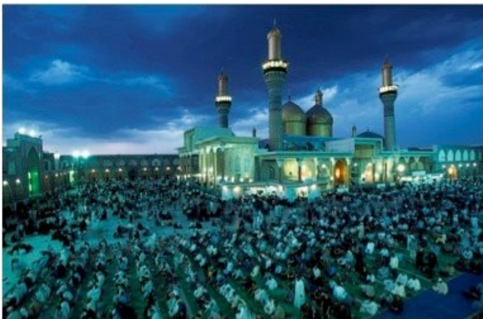
Najlepši so posnetki z večernim nebom v t.i. »modri svetlobi« (blue light), ko je sonce že za obzorjem, ni pa še zares tema.

Sijaj in kakovost sončne svetlobe se lahko zaradi vremena zelo spreminjata. Na jasnem danu je neposredna sončna svetloba večinoma preostra, saj ustvari temne sence, ki skrivajo pomembne podrobnosti. Če fotografiramo na zelo vlažen dan, bo sonce sicer metalo sence, vendar pa bodo mehkejša, ker se svetloba razprši, ko se odbija od vlage v zraku. Taka svetloba lahko fotografiji da določeno melanholičnost, ki je pri drugih podnebnih razmerah ni. Oblačni dnevi dajejo mehko svetlobo, ker oblaki razpršijo sončno svetlobo. Svetloba prihaja z vseh strani naenkrat, tako da včasih sploh ni senc. Ker ob oblačnih dnevih ni nobenega bleska, so odlična priložnost za slikanje portretov. Če nočete ostre svetlobe močnega sonca, premaknite tisto, kar slikate, v senco. V senci je svetloba, vendar gre za odbito svetlobo in ne neposredno sončno. Barva svetlobe se spreminja s časom dneva. Višje, kot je sonce na nebu, čez manj ozračja potuje njegova svetloba in bolj žive so videti barve. Ob zarji (in zori) čez ozračje ne pridejo krajše valovne dolžine svetlobe (modre in zelene), tako da svetloba dobi tople rumeno rdeče odtenke. V glavnem velja pravilo: pokrajine in posnetke na odprtem poskusimo narediti predvsem zelo zgodaj zjutraj in proti večeru, čez dan pa pri močnem soncu fotografiramo v senci ali v zaprtih prostorih, osvetljenih z odbito svetlobo.