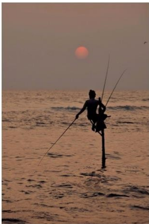
Pri tej fotografiji je bila nastavitev beline nastavljena ročno.

Barvna temperatura svetlobe se meri v stopinjah Kelvina. Dnevna svetloba ima vrednost nekje od 5000 do 6000st K (odvisno od njenega odtenka). Bolj, kot se število stopinj niža, bolj je svetloba rumena (npr. navadna žarnica ima 3200st K) in bolj, kot se število stopinj K viša, bolj je svetloba modra (npr. LED dioda ima 6500st K). Že po zelo kratkem času v nekem prostoru se naše oči (možgani) navadijo na dominantno barvo in jo potem zaznamo kot belo. Če npr. pogledamo bel list papirja v prostoru z navadnimi žarnicami se nam zdi, da je bel, kljub temu, da je v resnici popolnoma rumen. Pri fotoaparatih na film to rešujemo s pomočjo filtrov ali pa s posebnimi Tungsten filmi (za 3200st K), pri digitalnih aparatih pa z nastavitvijo beline (white balance). Avtomatska nastavitev beline je primerna za večino situacij, ki jih fotografiramo, če pa hočemo ujeti kakšno posebno svetlobo, pa raje nastavimo belino na dnevno svetlobo, torej 5300K (večina malo boljših fotoaparátov nam dopušča to možnost!). Aparat bo »mislil«, da je svetloba bela in bo vse zanimive odtenke svetlobe zaznal v njihovi pravi barvi. To je zelo primerno za npr. slikanje sončnih zahodov ali posebnih vremenskih razmer. Če take motive slikamo z avtomatsko nastavitvijo, se bo fotoaparat trudil svetlobo prikazati čim bolj realno in nam bo v npr. čudovit oranžni sončni zahod dodal modro barvo, ga s tem posivil in naredil povsem običajnega.