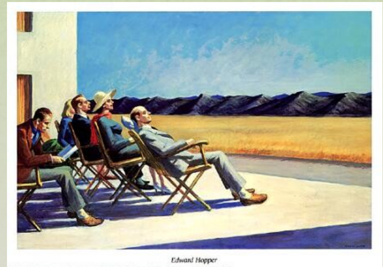
Ljudje na soncu, 1960