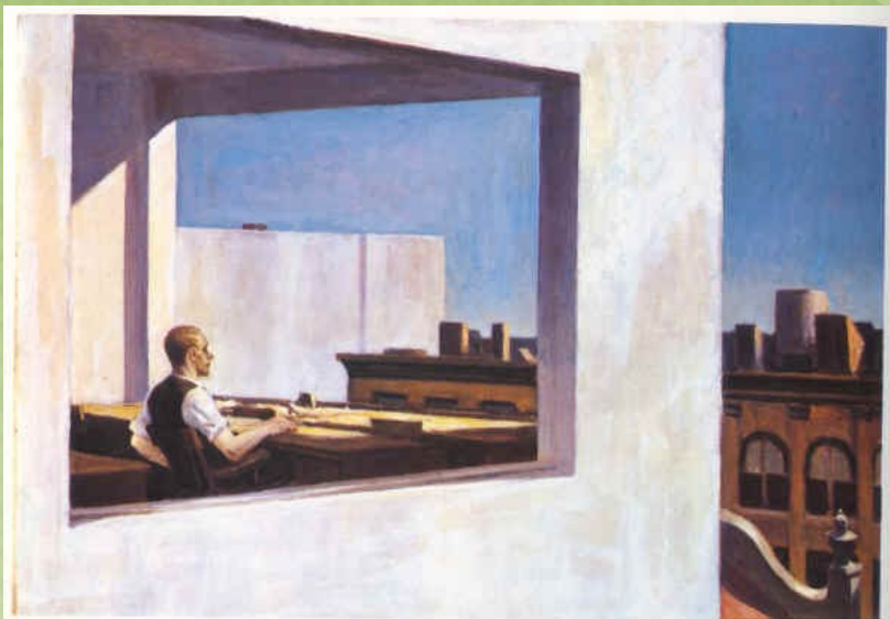
Pisarna v majhnem mestu, 1953