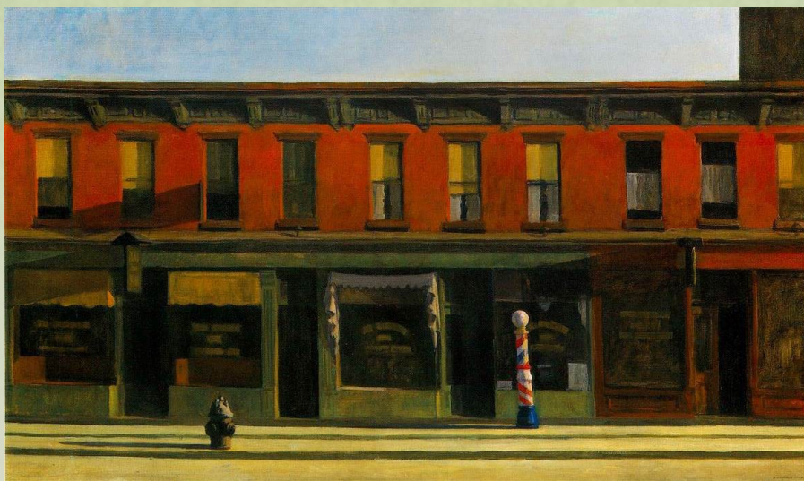
Zgodnje nedeljsko jutro, 1930