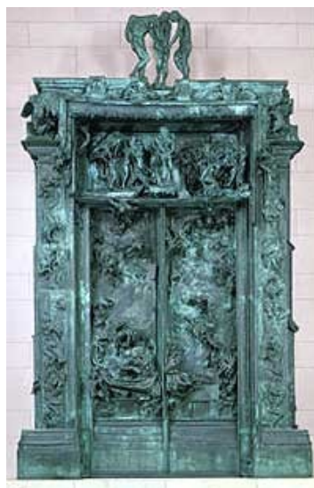
Slika 7: Auguste Rodin: Vrata pekla, 1880 -1917, Pariz, Musée Rodin

Impresionistične težnje k kiparstvu vsebujejo ista izhodišča kot slikarstvo: ujeti trenutek, drobec nepomembnega pogleda, utrinek iz zasebnega življenja. Zato tudi obravnavanje površine namenoma slikovito – impresionistični slikar je oblike teles »razdrobil« v številne poteze s čopičem, kipar pa je površino pustil »nezaglačeno«, torej sestavljeno iz številnih drobnih ploskev, ki se v pramenu svetlobe različno odzivajo. Značilno je tudi, da so bile vsebine naklonjene upodobitvam trenutka; impresionistični slikar Edgar Degas je v poznih letih ustvaril zaporedje kipcev balerin, ki so sijajne impresionistične plastike.