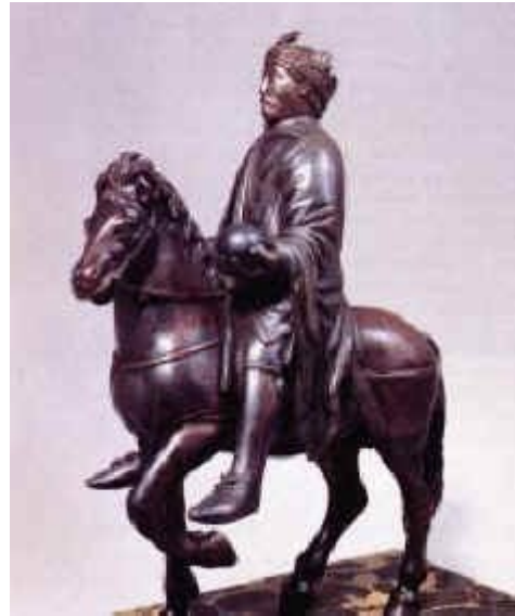
Slika 5. kipec Karla Velikega