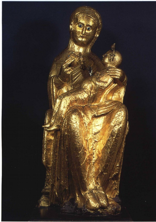
Slika 4: Otonski kipec Marije