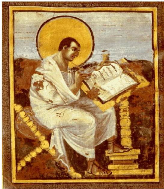
Slika 6: Evangelist Matej