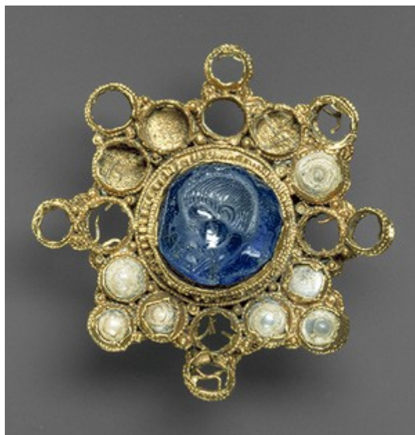
Slika 8: Otonska broška

Karolinška in otonska umetnost sta verski obdobji, slonita na antični in starokrščanski umetnosti. Za obe obdobji je značilno predvsem gradnja cerkva ter različno stensko slikarstvo. Karolinška umetnost traja nekje od konca 8. stoletja- sredine 10. stol, otonska pa od 963- 1024. za karolinško in otonsko kiparstvo so značilno razvoj oble plastike, naslonitev na antične vzore, obvladovanje raznih veščin. Delali so predvsem velike kipce iz kamna, marmorja, lesa ... Za slikarstvo do predvsem značilni mozaiki, težili so predvsem k vsebinsko prepričljivi upodobitvi, ki bi dobro posredovala sporočilo besedila, na katero se je slika nanašala. Pomembni so tudi zlatarski izdelki in iluminirani rokopisi.