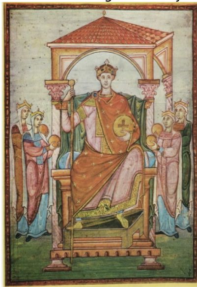
Slika 7: Evangeliar Otona III