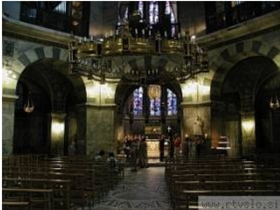
Slika 2: Dvorna kapela Karla Velikega