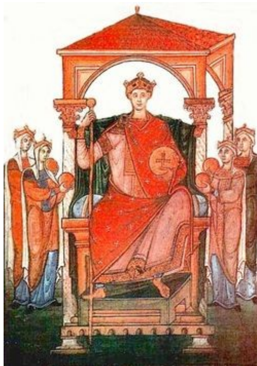
Slika 1: Oton II

Za oba obdobja je bil zelo pomemben Karel Veliki. Samostani so po reformi Karla Velikega ostali nosilci kulturnega in umetnostnega razvoja do leta 1200. oz. do konca visokega srednjega veka. Kar precej umetnikov poznamo po imenih, a skoraj vsi so bili iz cerkvenih krogov.