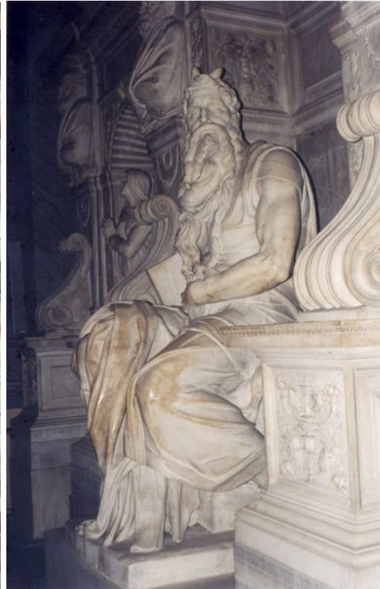
Michelangelov kip v podobi Mojzesa

Ko je Michelangelo končal Poslednjo sodbo, so ga obtožili obscenosti zaradi slik golih oseb, ki imajo vidne genitalije. Proti njemu so sprožili cenzorsko kampanjo, da bi slike odstranili, vendar je bil papež na Michelangelovi strani. Po Michelangelovi smrti je bil izdan zakon, da se genitalije prekrije.