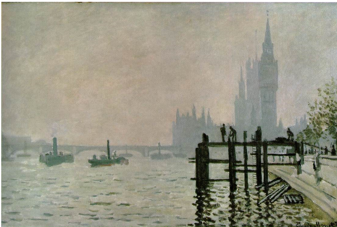
Sl. 4: Monet: Temza pod Westminsterским mostom

Na sliki Temze pod Westminsterским mostom je Monet ujel bežni trenutek jutranjega vzdušja. Na sliki opazimo mešanico megle in dima, ki je prepletena s šibkimi pomladanskimi sončnimi žarki, kar daje videz rumenkaste meglice. Sivkasto megličasto nebo uspešno priključuje v spomin meglo, po kateri je bil London tako razvpit. Dim iz parnikov je prikazan kot lahni zastori dima, ki prehajajo iz dimnikov v megleno ozračje. V ozadju prepoznamo stolpe Parlamenta in Westminsterski most, ki ovita v meglo delujeta skrivnostno, kar nekoliko strašljivo, za bolj razločnimi oblikami lesenega pomola in postav v ospredju na desni strani. Monet je trdil, da megla poslopuje da »čudovito širino, pravilni masivni bloki v skrivnostnem ogrinjalu postanejo veličastni.« Zanimali so ga predvsem