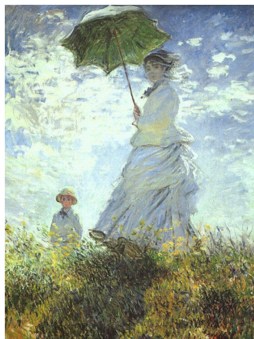
Sl. 3: Ženska s sončnikom

Leta 1875 je nastala ena njegovih najbolj znanih slik – Ženska z sončnikom, ki je bila naslikana v dveh verzijah.